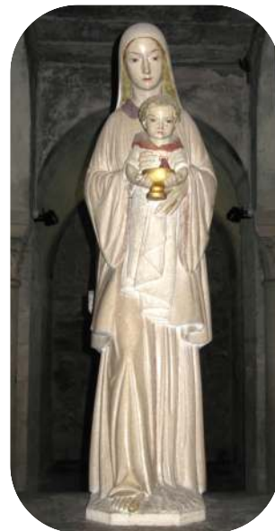
Vierge à l'enfant, par Henri Charlier, Issoire