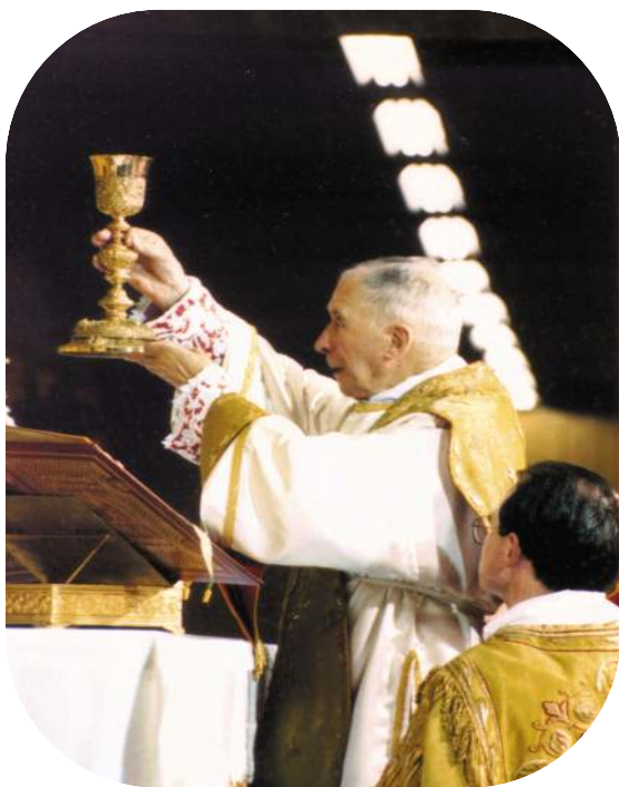
Mgr Lefebvre célébrant la messe

Le deuxième signe du Ciel : c'est que ce 25 mars 1991 est aussi la date anniversaire du rappel à Dieu de son Excellence Mgr Marcel Lefebvre, cet évêque à qui nous devons aujourd'hui la grâce de pouvoir assister régulièrement à la messe traditionnelle dans notre cher sanctuaire de Fontpeyrine, célébrée par les prêtres de la Fraternité Saint-Pie-X, congrégation fondée par ce même évêque en 1970, avant tout pour assurer la formation traditionnelle des prêtres.