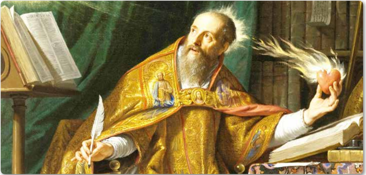
Saint Augustin (354 - 430), père de l'Église, par Philippe de Champaigne (1650)

Mais pour un esprit libéral, la première liberté, celle de se révolter contre Dieu, de blasphémer, ne peut être combattue. La liberté est pour lui un principe premier, qui n'accepte pas de vérité supérieure.