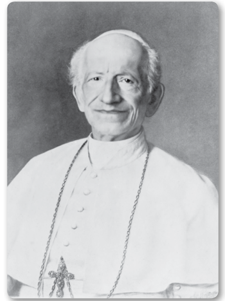
Léon XIII, pape de 1878 à 1903

Partant du principe fondamental que la société civile a Dieu pour auteur, Léon XIII en tire logiquement la conséquence qu'elle doit rendre un culte à Dieu. Mais parce que Dieu s'est révélé, et qu'il a précisé de quelle manière il voulait être honoré, ce culte que la société civile a le devoir de rendre n'est pas laissé au libre choix des souverains, il passe par l'Église ca-