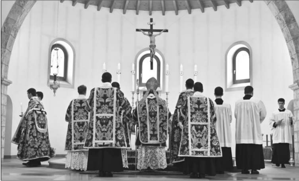
Sous-diaconat et seconds ordres mineurs, Ecône, 20 mars 2021

temps, que le Ressuscité nous a réservé une entrée dans le Royaume qu'il s'est acquis par son sang. Par saint Paul,