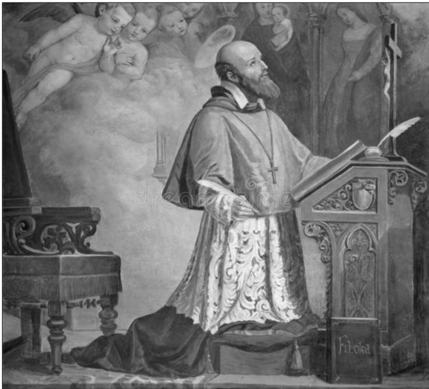
4 e centenaire du rappel à Dieu de saint François de sales + 28 décembre 1622