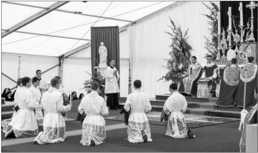
Ordinations, Écône, 1 er juillet 2021

que voulez-vous que je fasse ? » La demande est la même pour tous, même si l'inquiétude peut étreindre avant de répondre. Le Bon Dieu ne se retirera pas : en son nom et place, l'Évêque