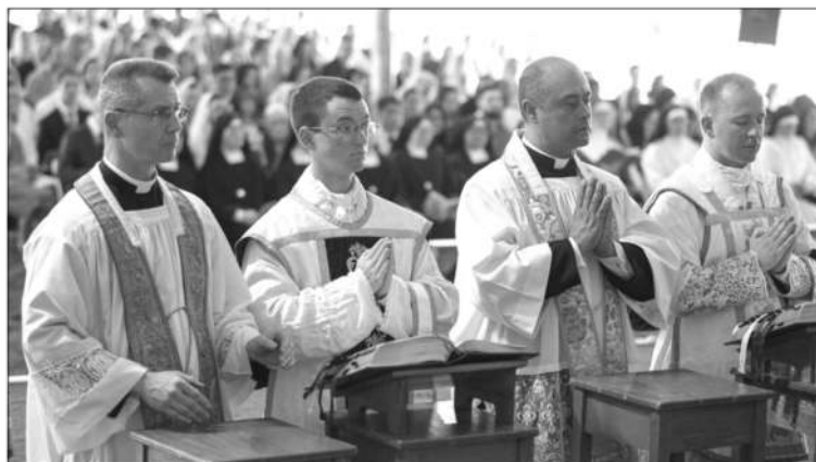
Ordinations, Dillwyn, juin 2021

tout le monde me félicitait, où je voyais les rires sur tous les visages alors que le mien cachait un sentiment partagé. Ce qui m'a aidé était la joie profonde que je ressentais chez mon fils. Bref, j'ai longtemps gardé au fond de moi une rancune contre vous, mais je savais que vous n'y êtes pour