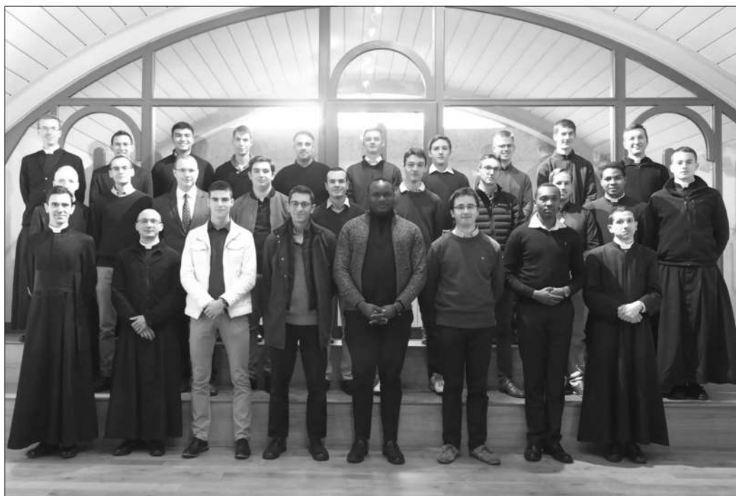
Séminaristes, Flavigny, septembre 2021

bout. Car voici pourquoi je te suis apparu : pour t'établir serviteur et témoin de la vision dans laquelle tu viens de me voir et