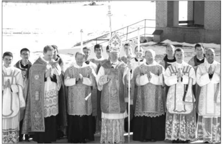
Ordinations, Dillwyn, 6 janvier 2022

Car lorsqu'il prépare les futurs époux à faire un vrai mariage catholique, ça sera pour moi quelques années après, des arrière-petits-enfants spirituels, si la foi et l'amour catholiques