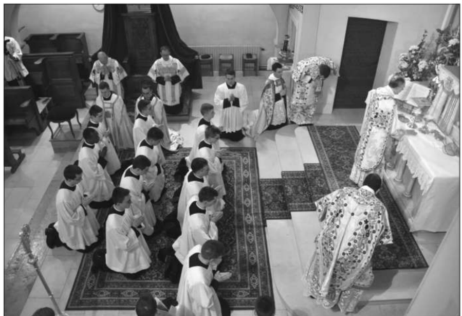
Prise de soutane, Flavigny, 2 février 2022

certifie l'appel et on entre, comme l'Apôtre, dans les voies de Jésus-Christ. Jamais on ne pourra dire comme saint Paul : « Le Christ m'est apparu à moi aussi... ne suis-je pas Apôtre ? N'ai-je donc pas vu Jésus, Notre Seigneur ? » Mais pourtant, à sa suite, comme tous les « légats » de Dieu, on révélera au monde le grand mystère de