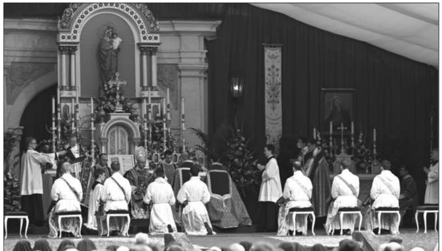
Ordinations, Zaitzkofen, 26 juin 2021