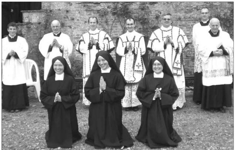
Premiers vœux, Sœurs de la Fraternité Saint-Pie X

Tout cela, Monseigneur, a donné un sens à ma vie, à mon sacrifice de voir mon fils partir ; mais plus encore, m'a élevée, m'a montée vers Dieu, moi qui étais si médiocre avant. Je fus enthousiasmée, et je le suis encore ; grâce à vous, ma vie fut belle ; merci Monseigneur, d'avoir rendu mon fils prêtre !