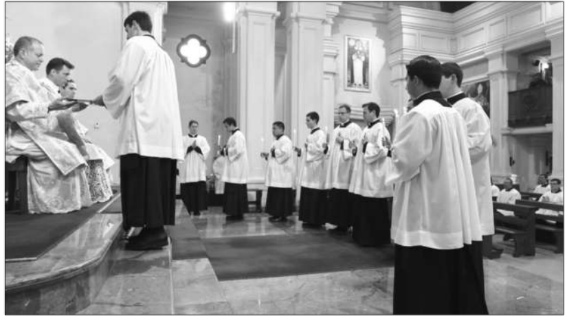
Prise de soutane, La Reja, août 2021

l'apostolat de mon fils par mes chapelets, mes lectures spirituelles, mes petits sacrifices bien minables mais faits de tout cœur, puis mes messes chaque jour depuis que mon mari