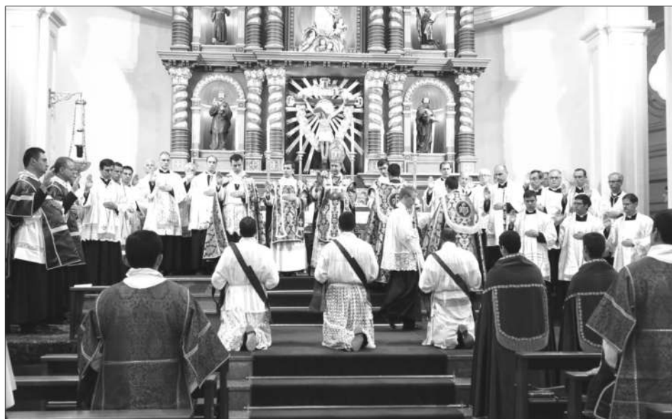
Ordinations, La Reja, 18 décembre 2021

Et combien de messes a-t-il célébrées ? plus de dix mille d'après mes calculs. Ça doit vraiment produire quelque chose. J'ai toujours pensé que c'est surtout l'affermissement des chrétiens plus que la conversion des autres, parce que les textes du canon de la Messe parlent plus de ça que de la conversion des païens.