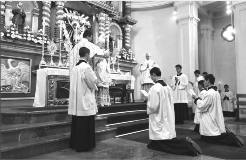
Noviciat des Frères, La Reja (Argentine), octobre 2021

Tout a commencé par une lettre reçue d'une dame que je ne connaissais pas (une amie d'une ancienne paroissienne