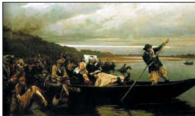
18 octobre 1793 : passage de la Loire à Saint-Florent-le-Vieil. Lescure, mortellement blessé, mourra le 4 novembre suivant.

noyant. Les Blancs se dirigent vers la Bretagne pour y rejoindre – pensaient-ils – un corps expéditionnaire anglais attendu à Saint-Malo. Ce sera la Virée de galerne .