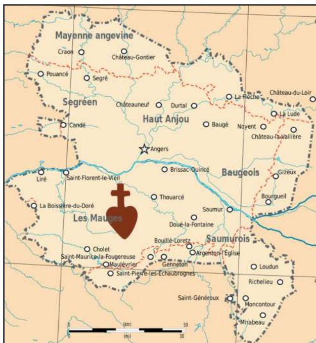
L'Anjou avant 1789

Après avoir décrété l'abolition de la royauté (21 septembre 1792), la Convention nationale assassine le roi Louis XVI (21 janvier 1793) et décide une conscription de 300 000 hommes (célibataires âgés de 18 à 25 ans) pour défendre la République aux frontières. Certaines communes doivent organiser des tirages au sort afin de former le contingent réclamé par la Convention. C'est le cas à Saint-Florent-le-Vieil, en Anjou, le dimanche 10 mars 1793, lorsque le procureur syndic Duval donne lecture du décret portant sur la levée en masse. Deux jours plus tard, le 12 mars, les jeunes gens convoqués pour le tirage au sort entrent dans Saint-Florent, au son du tocsin, accompagnés de plusieurs centaines de personnes, armées de bâtons, de fusils et de faux. L'officier municipal, Jacob, harangue la foule devant la célèbre abbaye, au cœur du village. Mais la fureur monte et Jacob est tué. Deux coulevrines aux mains des républicains font feu sur la foule tuant dix hommes et en blessant