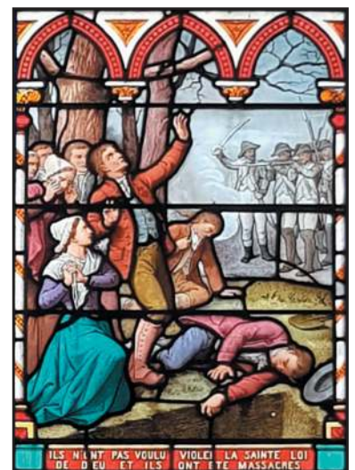
Vitrail de la chapelle du Champ des Martyrs d'Avrillé par Jean Clamens, 1894

aux Ponts-de-Cé (au sud d'Angers) où 1500 à 1600 prisonniers sont passés par les armes. Au Marillais, près de Saint-Florent-le-Vieil, où la Vierge Marie est apparue à saint Maurille en 430, le nombre des victimes fusillées est généralement estimé à 2000. Entre le 23 et le 26 mars 1794, les colonnes infernales des républicains Grignon et Crouzat massacrent près de 3000 personnes dans la