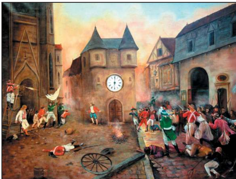
La Bataille de Cholet

Tous les fidèles connaissent, au moins dans ses grandes lignes, l'histoire de la Vendée militaire, territoire qui s'est soulevé en mars 1793 lorsque la Convention, après avoir assassiné le roi Louis XVI (21 janvier 1793), décréta la conscription de 300 000 hommes pour aller combattre aux frontières. Ce territoire comprenait une partie des anciennes provinces du Poitou, de la Bretagne et de l'Anjou et était composé de plus de 700 villages, peuplés au début de la guerre de 750 000 habitants, tous profondément attachés à leurs prêtres réfractaires, c'est-à-dire à ceux qui avaient refusé de prêter serment à la Constitution civile du clergé. L'histoire a retenu le terme de Vendée militaire parce que la première grande bataille rangée eut lieu dans le département de la Vendée, le 19 mars 1793, au nord de Saint-Vincent-Sterlanges près de Chantonay. Mais, n'aurait-il pas été plus juste de parler d' Anjou militaire pour désigner cette terre soulevée contre la République puisque :