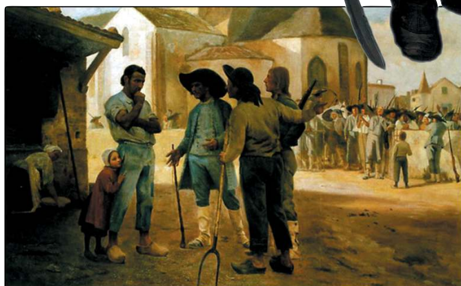
Les Angevins demandent à Cathelineau de prendre la tête de l'insurrection (peinture de Jules Gabriel Hubert-Sauzeau, 1900)

C'est Maurice d'Elbée, angevin d'adoption, qui succéda à Jacques Cathelineau comme 2 ème généralissime de l'Armée catholique et royale. Bien que né à Dresde en 1752, Maurice Joseph Louis Gigost d'Elbée s'établit à Beaupréau en Anjou au lieu-dit La Loge à l'âge de vingt ans. En 1793, les paysans de Beaupréau le mettent à leur tête. Il sert d'abord sous Cathelineau puis, à la mort de ce dernier, est choisi pour lui succéder. Au jugement de ses contemporains, d'Elbée fut un homme pieux, d'un courage remarquable. Ses soldats l'avaient surnommé le général La Providence parce