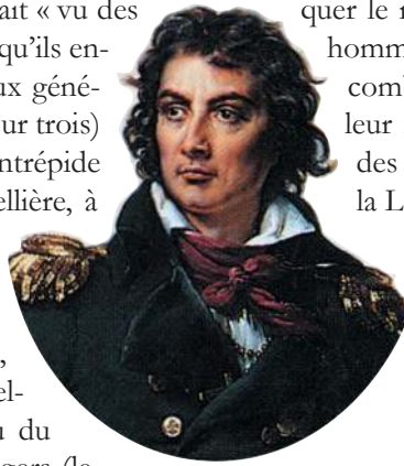
Le général d'Elbée

Parmi les chefs les plus connus, citons deux autres angevins, l'un de naissance, l'autre d'adoption. Tout d'abord, Charles-Melchior-Artus de Bonchamps, né au château du Crucifix à Juvardeil, situé au nord-est d'Angers (le château n'existe plus) qui a grandi dans une autre propriété familiale à la Baronnière, dans les Mauges près de La Chapelle-Saint-Florent. Il fut un excellent militaire et s'illustra dans l'épisode fameux du Pardon de Bonchamps . Quant à Jean-Nicolas Stofflet, il est né en Lorraine en 1753. Il fut soldat d'un régiment suisse dans l'armée française commandée par le comte de Colbert de Maulévrier. Il suivra le comte des années plus tard en Anjou pour devenir son garde-chasse au château de Maulévrier, au sud des Mauges.