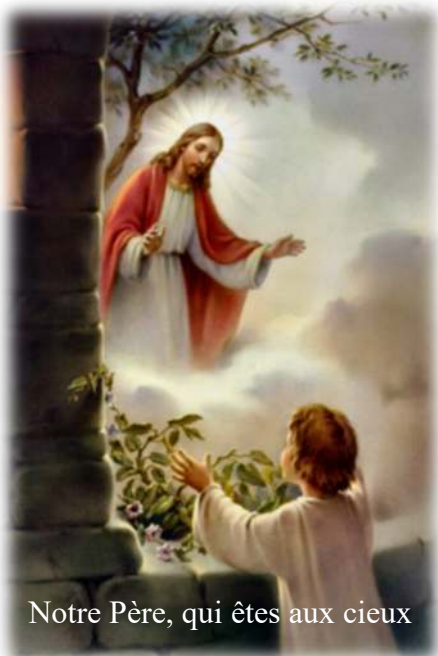
Notre Père, qui êtes aux cieux

Courage, chers Croisés, soyez toujours bien généreux !