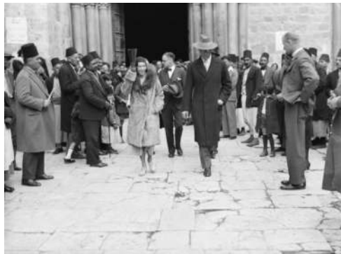
Le Roi Albert à l'église du Saint-Sépulcre (Jérusalem) en 1933.

« Nous [considérons heureux les empereurs chrétiens] s'ils exercent le pouvoir avec justice, si, au milieu des louanges des flatteurs et des saluts serviles des courtisans, ils ne deviennent pas orgueilleux et s'ils se souviennent qu'ils sont