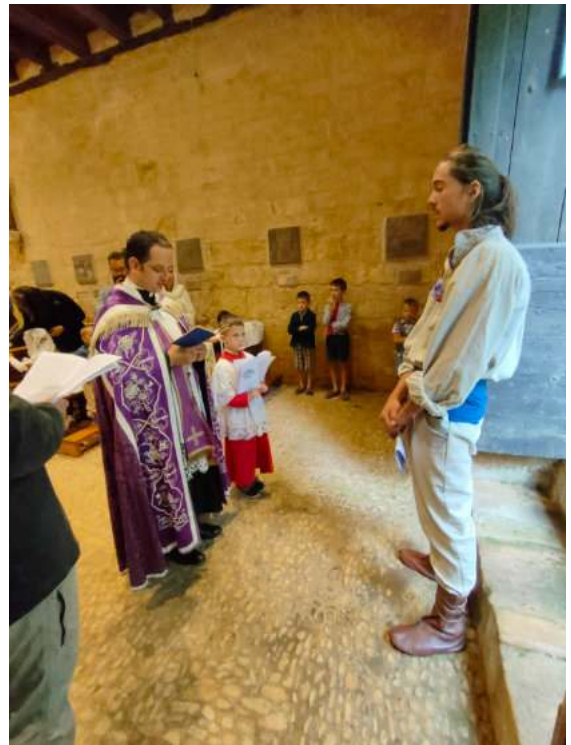
Introduction du futur chrétien dans le sanctuaire

Malgré les nuages qui couvrent encore le ciel, ce jour de l'Assomption s'annonce magnifique : la journée commence par un baptême d'adulte. De mémoire de pèlerin, c'est la première fois qu'une telle cérémonie a lieu au sanctuaire. Le grand concours de pèlerins (autant et peut-être même plus qu'en 2017, lors du jubilé !) a la