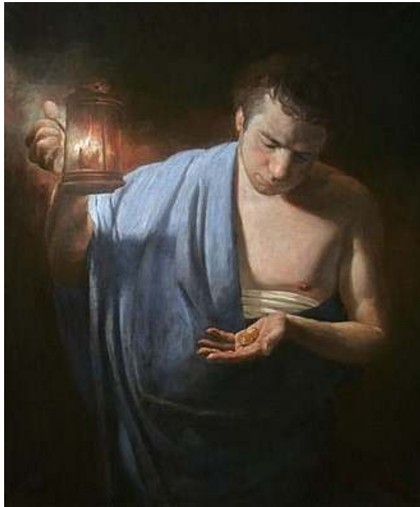
Parabole des Talents par Andrei Mironov (2013)

« Le vrai sage évite ces deux écueils ; il pèse toute chose, sait compatir aux misères et aux faiblesses qui l'environnent, tient compte des causes lointaines qui les ont préparées et démêle ce qui reste de bonnes tendances, de désirs nobles et sincères, bien que mal dirigés, dans cette confusion présente des choses. Il sait donc attendre ; et quand il agit, il seconde avec soin toute tendance qui peut prédisposer le prochain à mieux