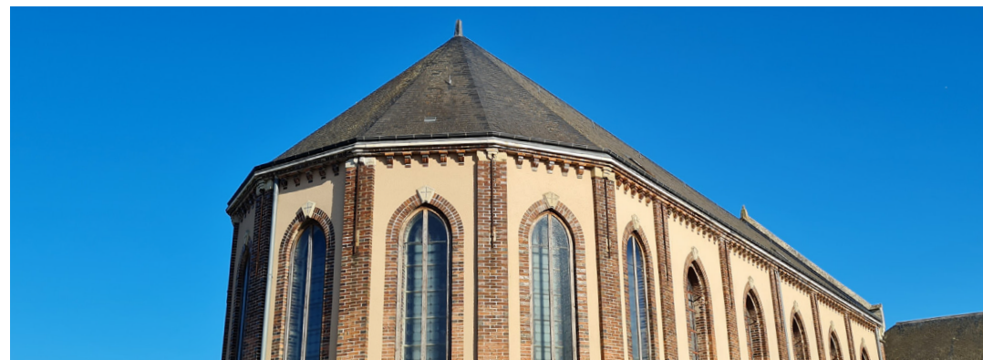
CHAPELLE SAINT-PIE X | CHARTRES