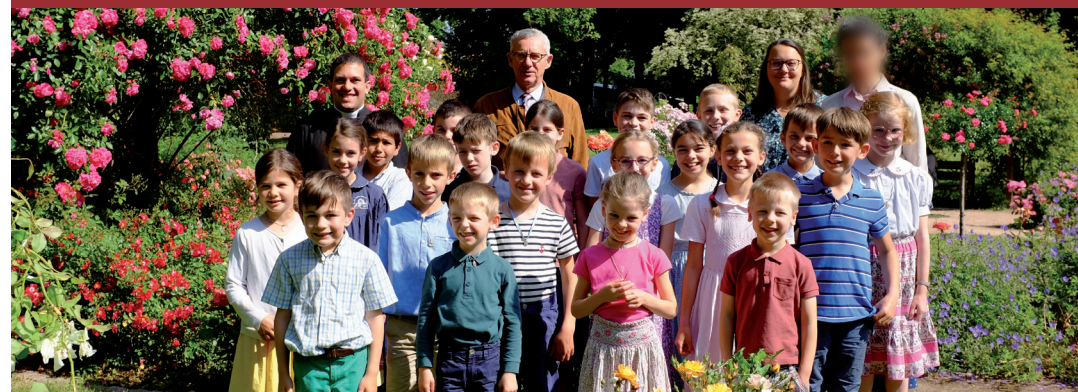
ÉCOLE SAINT-JOSEPH | CHARTRES