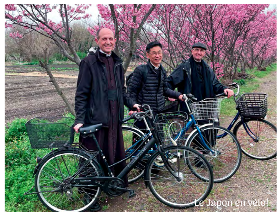
Le Japon en vélo!

Nous apprécions grandement votre soutien inlassable à nos projets en cours !