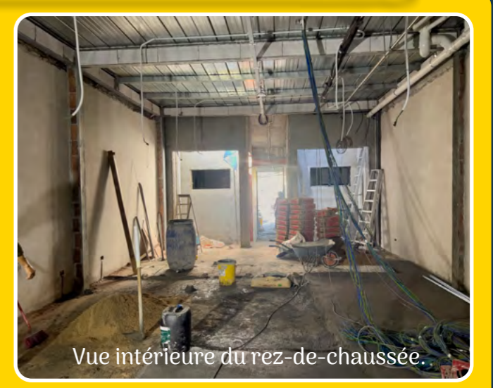
Vue intérieure du rez-de-chaussée.