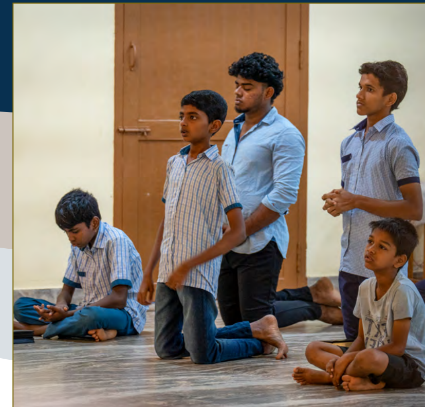
Les visages de ces jeunes en disent long sur leur dévotion à la prière.