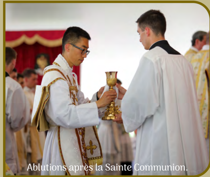
Ablutions après la Sainte Communion.