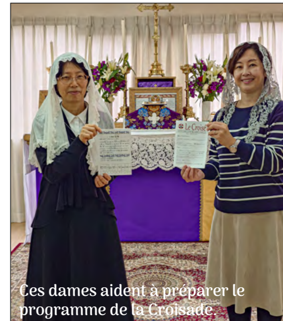
Ces dames aident à préparer le programme de la Croisade.