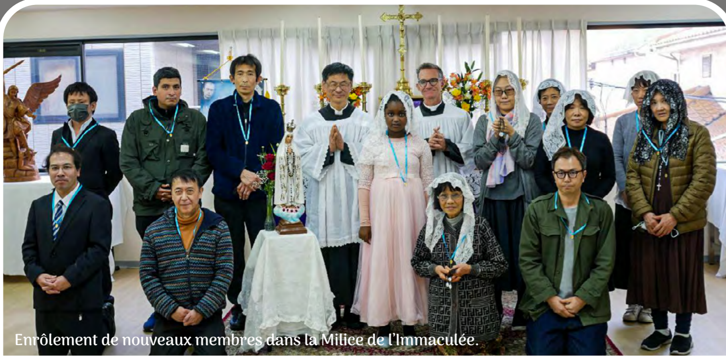
Enrôlement de nouveaux membres dans la Milice de l'Immaculée.