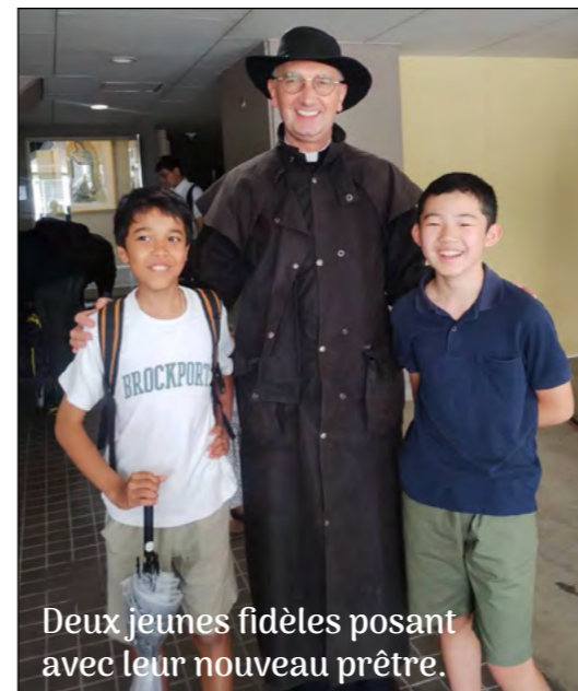
Deux jeunes fidèles posant avec leur nouveau prêtre.