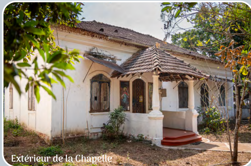
Extérieur de la Chapelle