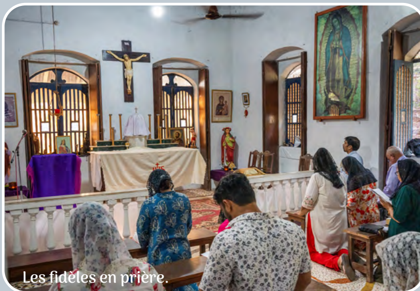
Les fidèles en prière.