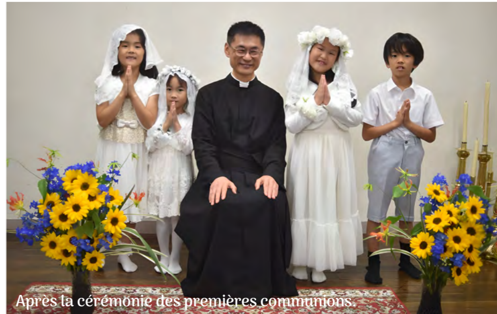
Après la cérémonie des premières communions.