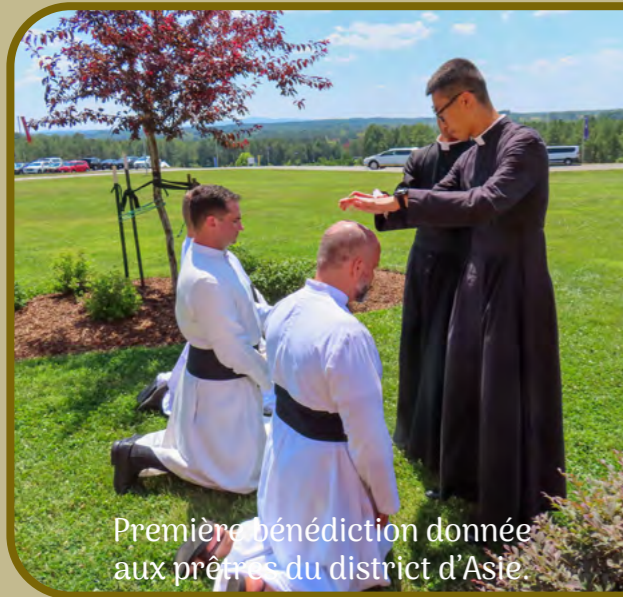
Première bénédiction donnée aux prêtres du district d'Asie.