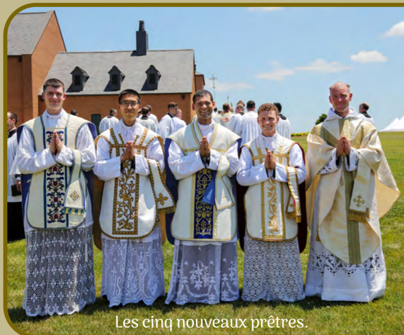
Les cinq nouveaux prêtres.