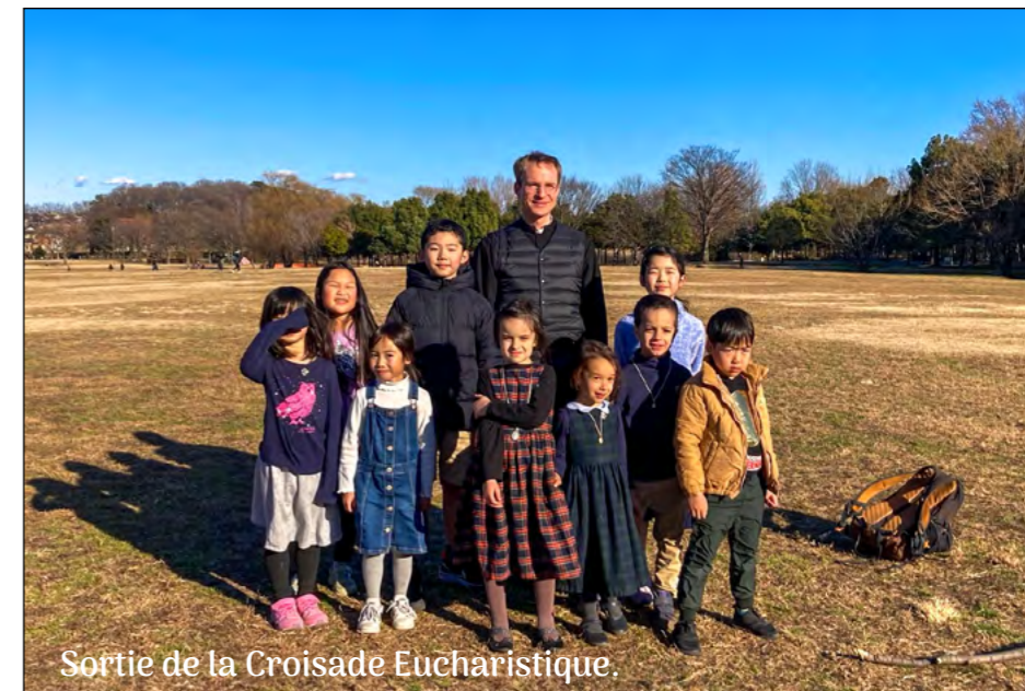
Sortie de la Croisade Eucharistique.

La Croisade eucharistique a été fondée pour encourager les jeunes à la sainteté. Sa devise : « Prie, Communie, Sacrifie-toi, Sois Apôtre ».