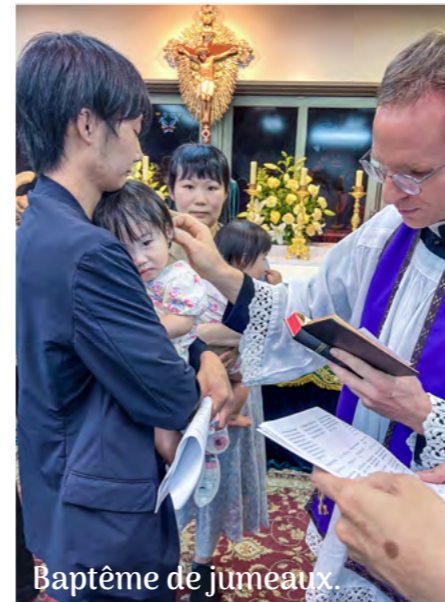
Baptême de jumeaux.