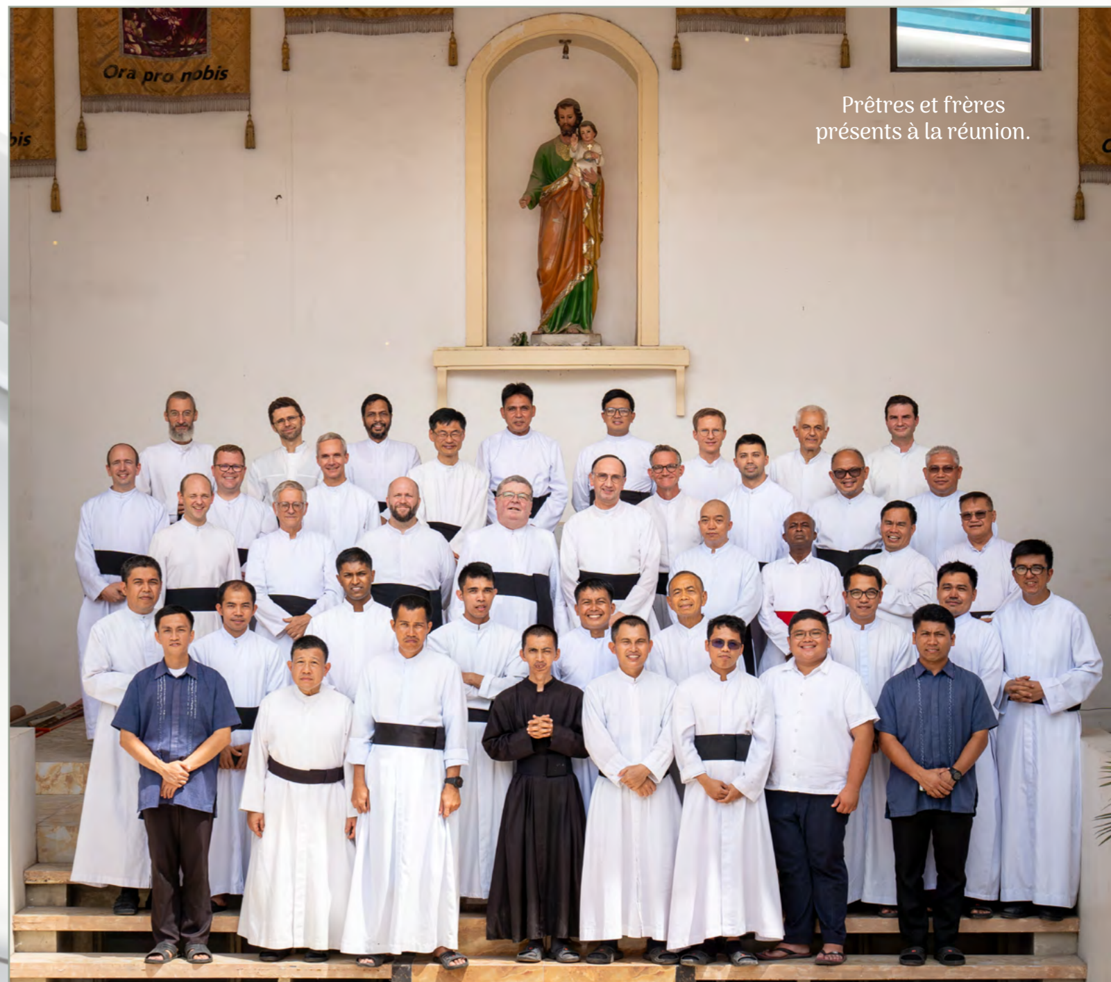
Prêtres et frères présents à la réunion.