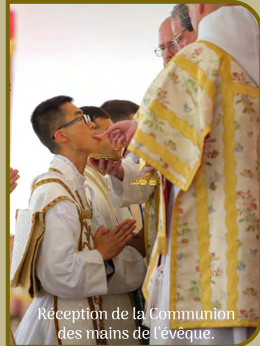
Réception de la Communion des mains de l'évêque.