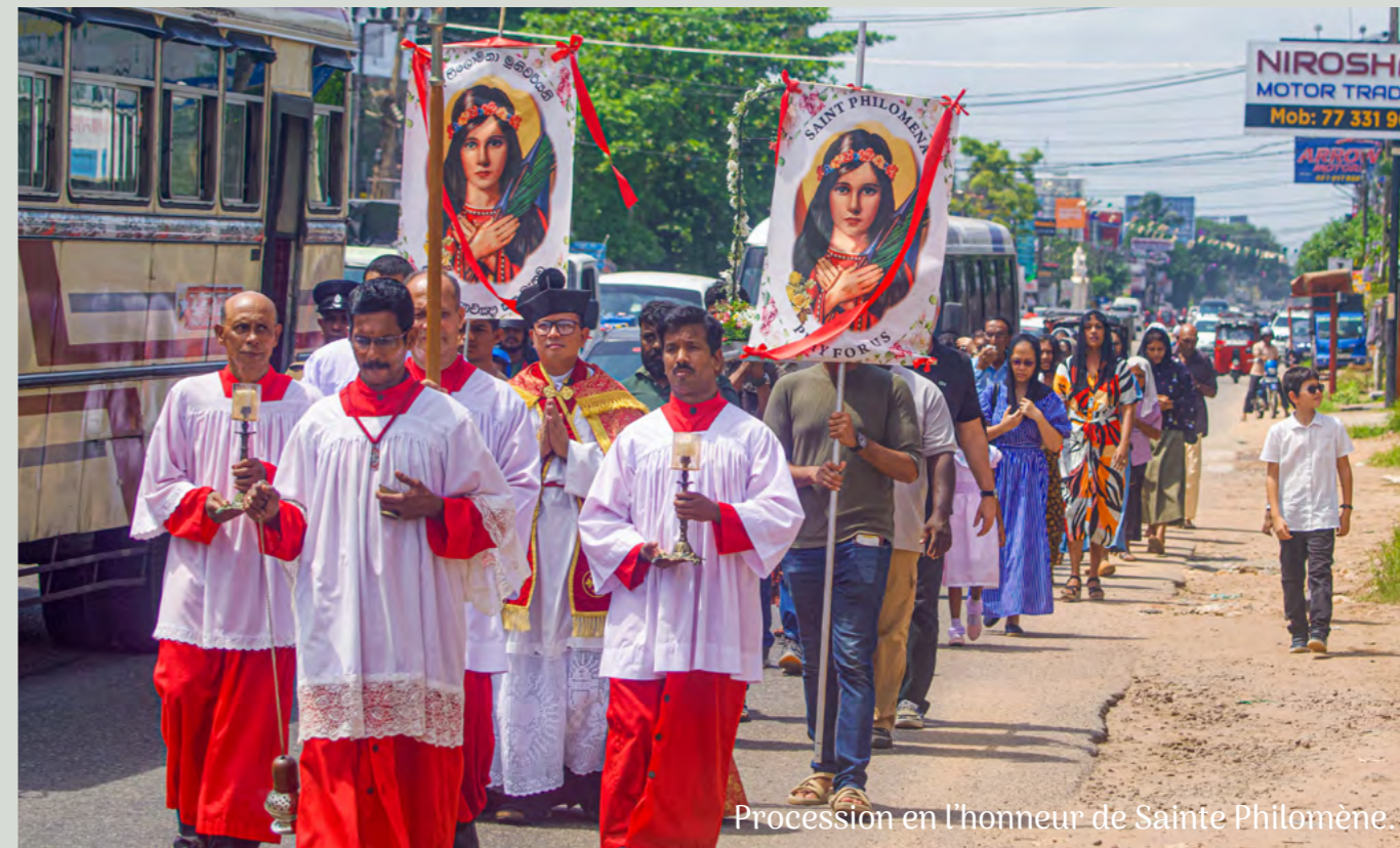
Procession en l'honneur de Sainte Philomène.

Ce qui est étonnant, c'est que les gens ne viennent pas seulement le jeudi soir, mais tous les jours de la semaine et durant toute la journée. Ils viennent de partout pour remercier la sainte es grâces qu'ils ont reçues par son intercession. Nous avons reçu des visiteurs d'Inde, du Moyen-Orient, d'Angleterre et même des États-Unis. Les statues et les béquilles sont des offrandes courantes, en plus des fleurs et des plantes. Le plus souvent, il s'agit d'une petite pièce de monnaie enveloppée dans du tissu et trempée dans de l'huile. Si les habitants des pays occidentaux peuvent comprendre le concept des fleurs ou des statues, la pièce de monnaie et l'huile peuvent sembler étranges. En y réfléchissant, cependant, nous nous rappelons, comme dans le cours de catéchisme pour le sacrement de la confirmation, que l'huile est vivifiante et de grand prix, raison pour laquelle elle est utilisée pour oindre les personnes dévouées à Dieu. Dans cet exemple, en offrant la pièce de monnaie trempée dans l'huile, ils offrent une partie d'eux-mêmes, quelque chose de précieux et nécessaire à la vie.