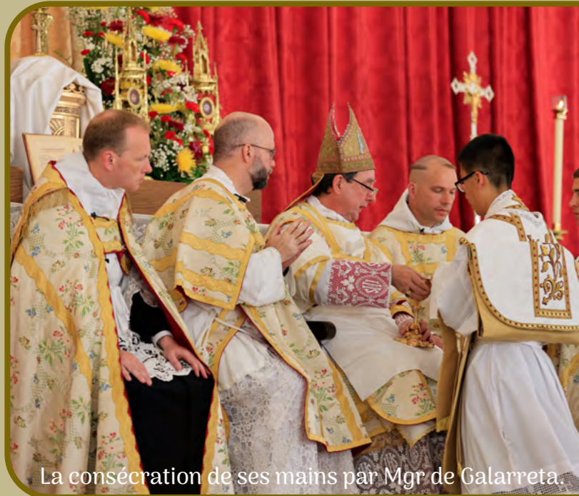
La consécration de ses mains par Mgr de Galarreta.