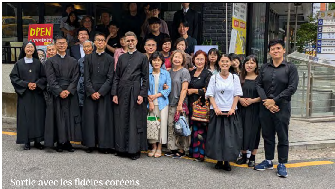
Sortie avec les fidèles coréens.