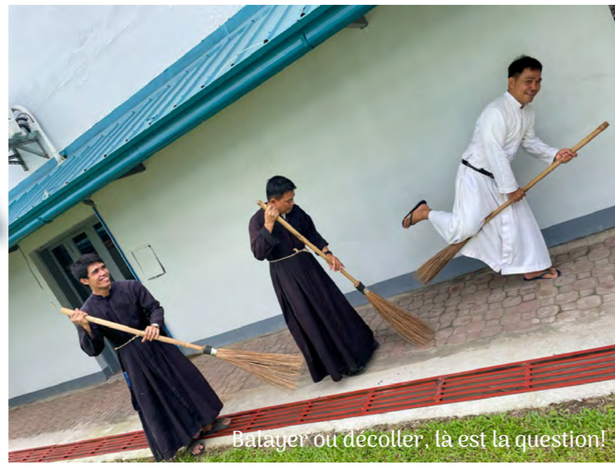
Balayer ou décoller, là est la question!