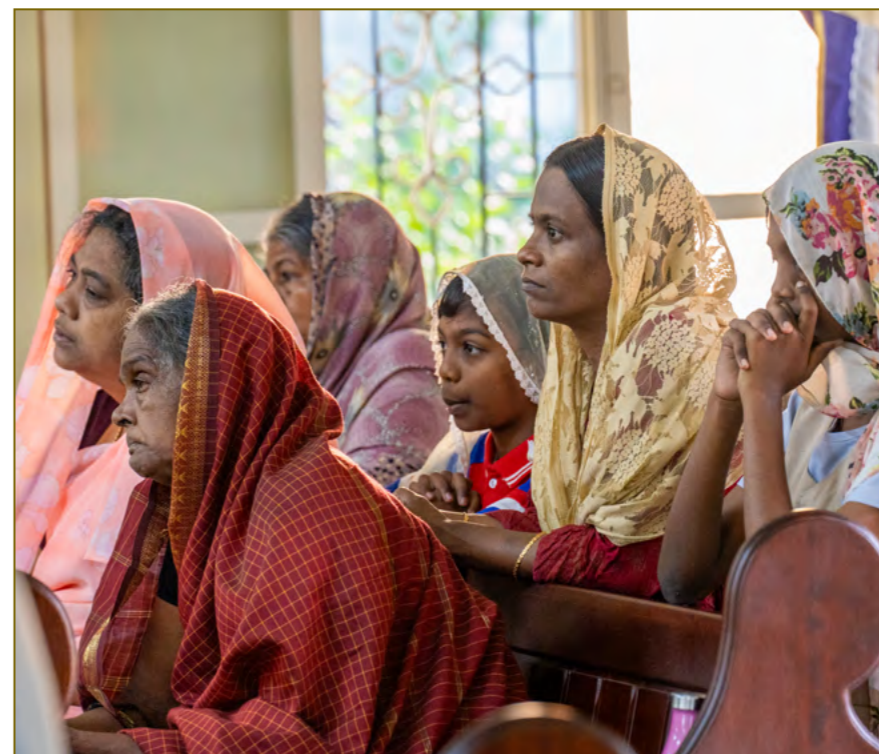
Grande attention et dévotion à la Présence réelle de Notre Seigneur Jésus-Christ, pendant la célébration du Saint Sacrifice de la Messe.