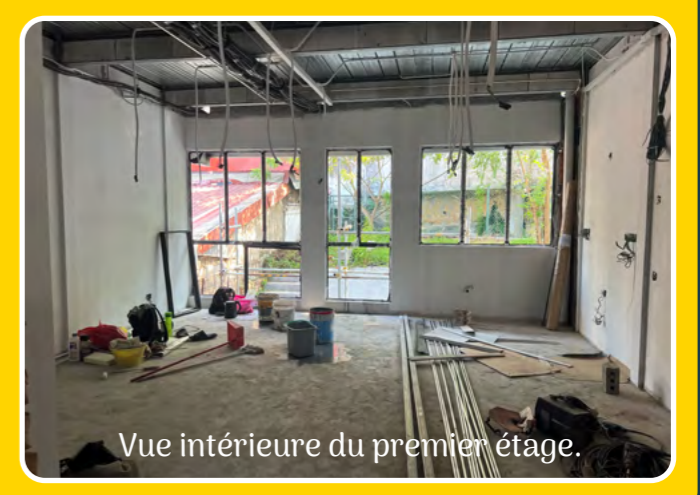
Vue intérieure du premier étage.