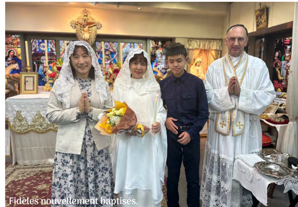
Fidèles nouvellement baptisés.

Jusqu'en décembre 2023, la messe à Tokyo était célébrée chaque dimanche dans un local loué pour quelques heures. La nouvelle chapelle est maintenant louée en permanence ce qui permet aux fidèles de se sentir chez eux. La nomination d'un chef de chœur professionnel a considérablement amélioré le chant grégorien.