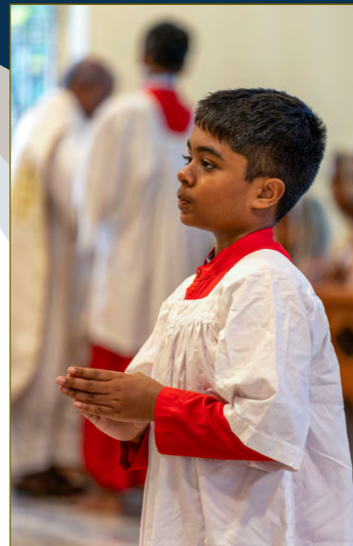
Un servent d'autel attentif à son devoir.