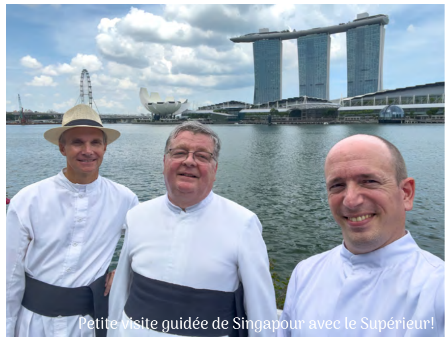
Petite visite guidée de Singapour avec le Supérieur!