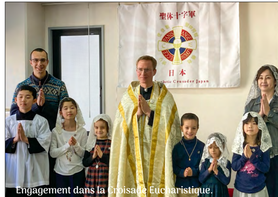
Engagement dans la Croisade Eucharistique.