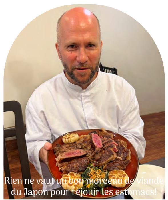
Rien ne vaut un bon morceau de viande du Japon pour réjouir les estomacs!