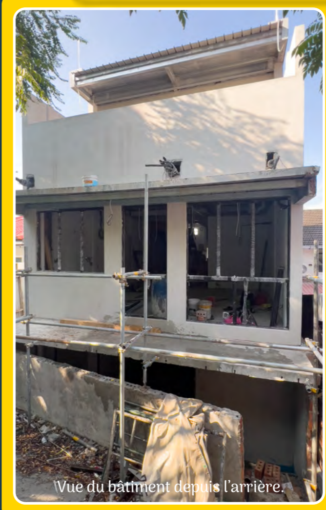
Vue du bâtiment depuis l'arrière.