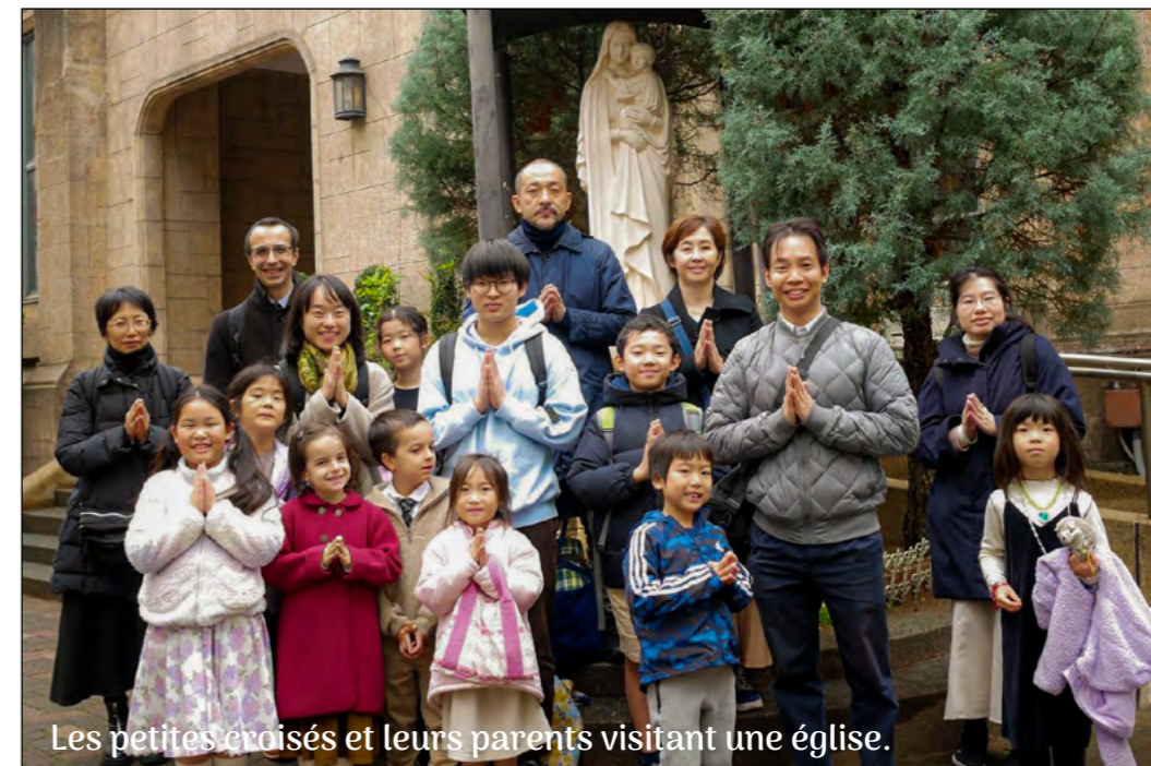
Les petites croisés et leurs parents visitant une église.

La Croisade eucharistique a été fondée pour encourager les jeunes à la sainteté. Sa devise : « Prie, Communie, Sacrifie-toi, Sois Apôtre ».