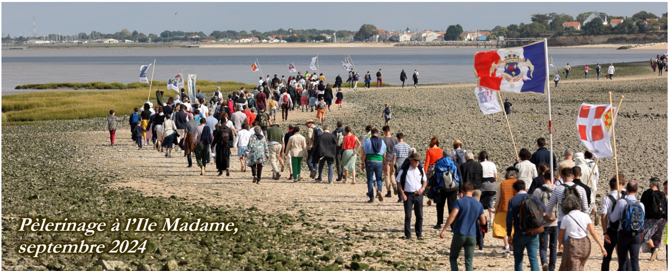
Pèlerinage à l'Île Madame, septembre 2024

tesse, de lui redonner son sourire. Nous sommes là, très nettement, dans le registre de l'affection, de l'amour, de la charité.