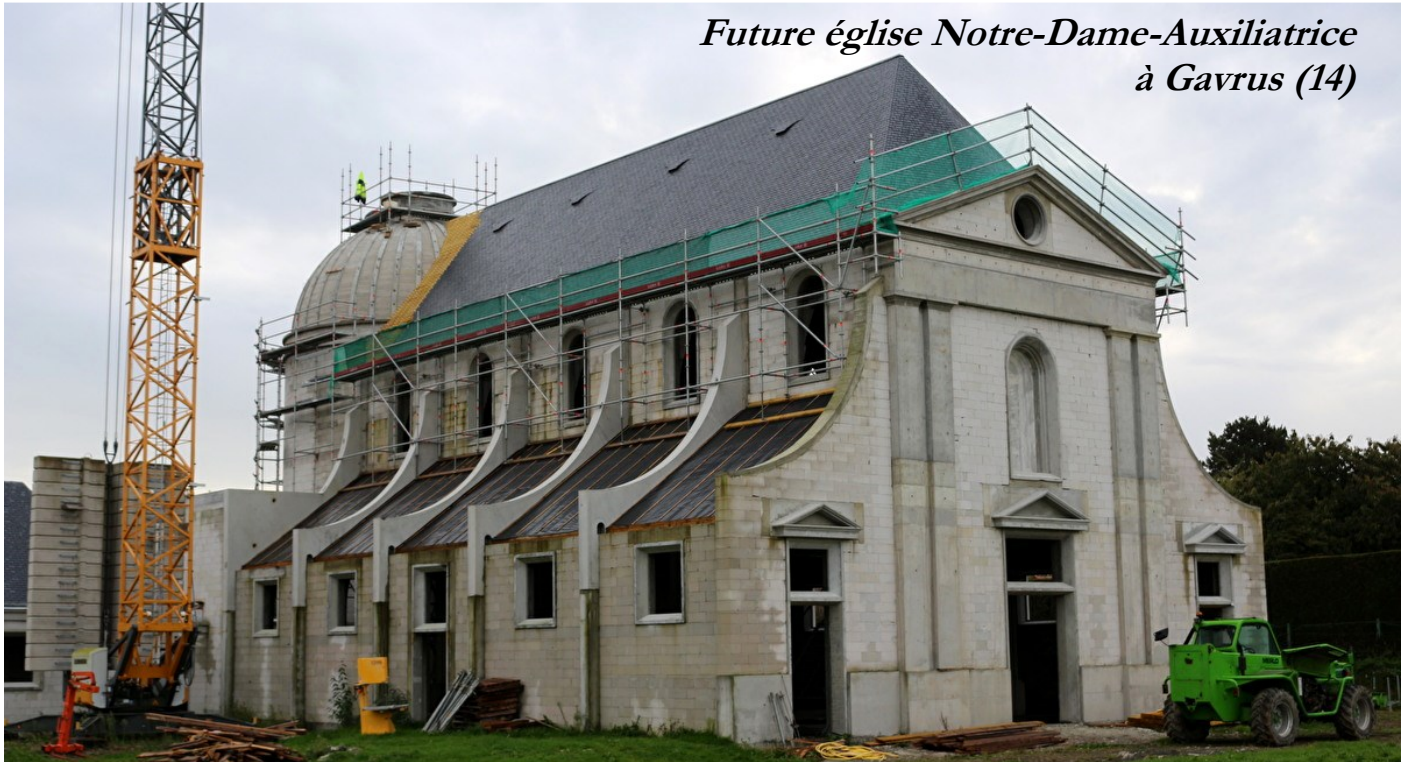
Future église Notre-Dame-Auxiliatrice à Gavrus (14)

nue trop petite. A Reims, après avoir confié école primaire et prieuré attendant aux dominicaines, nous nous sommes installés à quelques kilomètres dans une nouvelle maison qui demande de lourds travaux. En Vendée, le prieuré, la chapelle, tout est trop petit. Bientôt, à quelques kilomètres de l'école primaire, ces locaux exigus seront remplacés par de vastes bâtiments qui deviendront prieuré, chapelle et salles paroissiales pour le plus grand bien spirituel de tous.