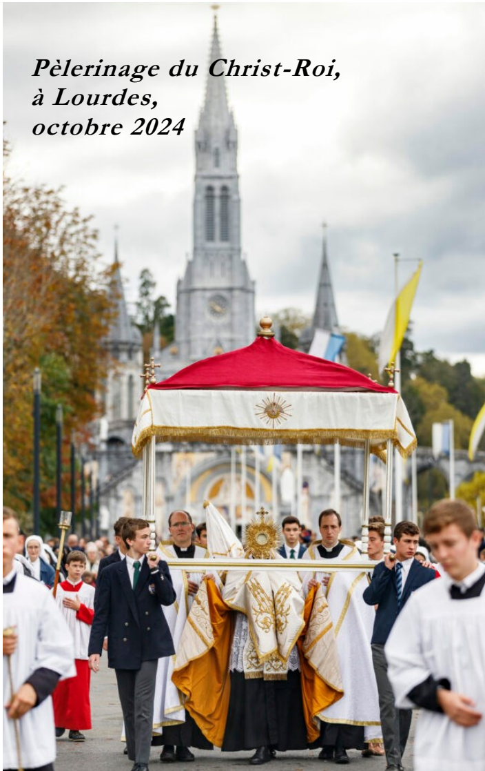
Pèlerinage du Christ-Roi, à Lourdes, octobre 2024

C'est évidemment à nous, qui voulons être les amis du Sacré-Cœur, qu'il convient au premier chef de réagir face à ces attaques contre sa divinité, son amour miséricordieux, son Église. Nous devons le faire dans l'espace public, dès