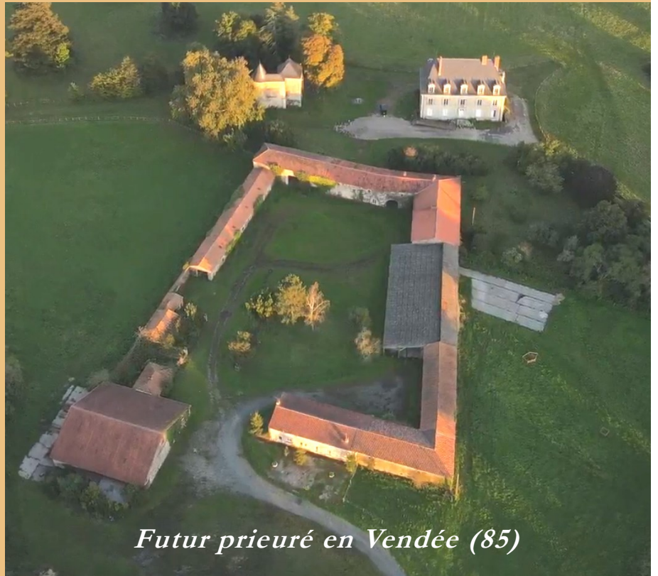
Futur prieuré en Vendée (85)

Nous sommes contraints alors d'acquérir des locaux commerciaux pour les transformer à grands frais en cha-