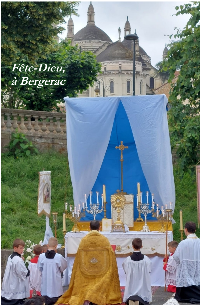
Fête-Dieu, à Bergerac

En sorte qu'il existe bien trois éléments, d'une valeur croissante, dans la « réparation », qu'elle soit matérielle ou spirituelle. D'abord l'effort, l'investissement, le renoncement (dans le domaine spirituel, le sacrifice). Ensuite, le souci de remettre les choses en place, de restaurer l'ordre. Enfin, le désir de faire plaisir, de manifester un amour, de consoler.