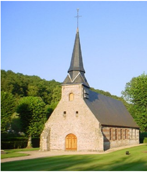
Église Saint-Denis du Hanouard

une âme chrétienne le jour de son baptême... et sa dépouille 95 années plus tard. En parcourant la vie de la défunte, elle qui n'avait pourtant ni croisé les mers, ni escaladé les montagnes, c'est-à-dire sans éloignement, ni exil, nous avons pu admirer le sens de l'attachement paroissial, enraciné dans ce Pays de Caux, pour mieux désirer le Ciel.