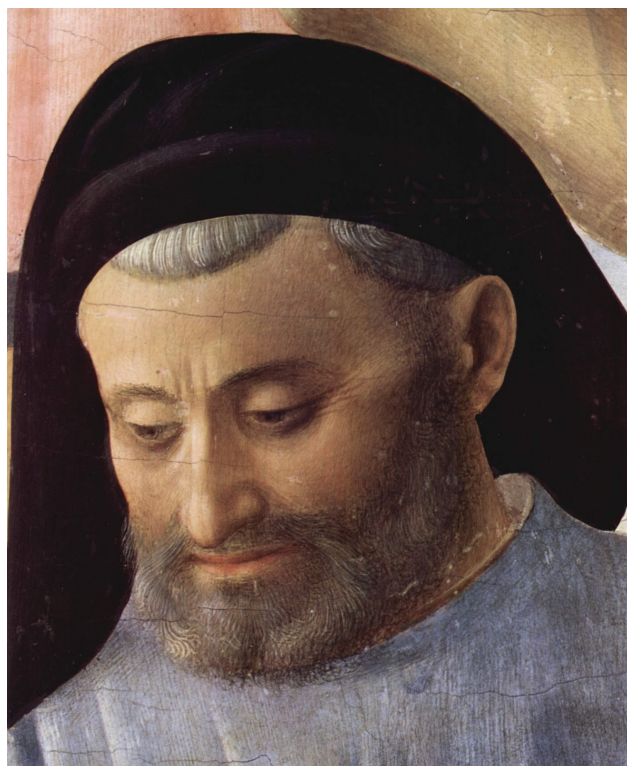
Probable autoportrait de Fra Angelico - idem

l'intervention du Dieu des miséricordes, c'est la Sagesse qui venait à elle. Elle découvrit que le Seigneur avait tout organisé jusqu'à la rencontrer, elle découvrit, le cœur bondissant, que la réalité présente vécue avec lui n'était plus un enfermement, et qu'elle ouvrait tout droit sur la vie éternelle. Elle découvrit que la vie éternelle, une bonne fois, c'est lui, Jésus de Nazareth, ce jeune prophète à la sainteté et à l'harmonie à couper le souffle. Car cet homme est Dieu, «la splendeur de sa gloire, et l'empreinte de sa substance», comme dira bien plus tard saint Paul, au début de son Épître aux Hébreux. Il est donc la sagesse et l'harmonie personnifiées, sa main guérit