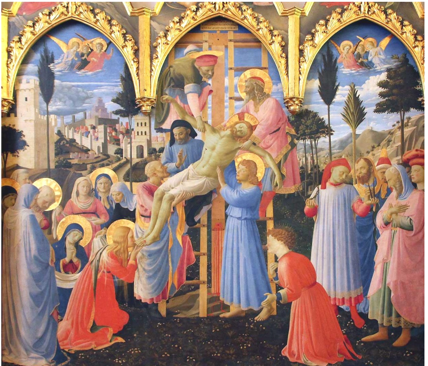
Descente de Croix par Fra Angelico en 1432/1434 — Panneau principal du retable de la Sainte-Trinité — Florence

poche), le jardin de Béthanie ou celui des Oliviers (Jésus est pour toujours le prince des jardins et des jardiniers, et autres amateurs d'horticulture). Marie de Magdala avait goûté les fastes de la Cour d'Hérode, mais elle leur préfé-