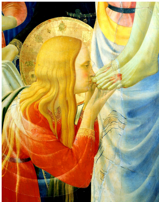
Sainte Marie-Madeleine Détail de la Descente de Croix par Fra Angelico

pouvoir sur les puissants de ce monde. « Connaître le bien et le mal n'est pas péché, et ne conduit pas du tout à la mort, tout au contraire, c'est le chemin de