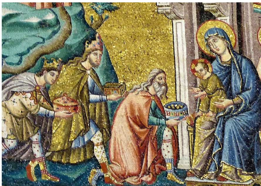
Pietro Cavallini (1250-1330), Adoration des Mages, Santa Maria in Trastevere