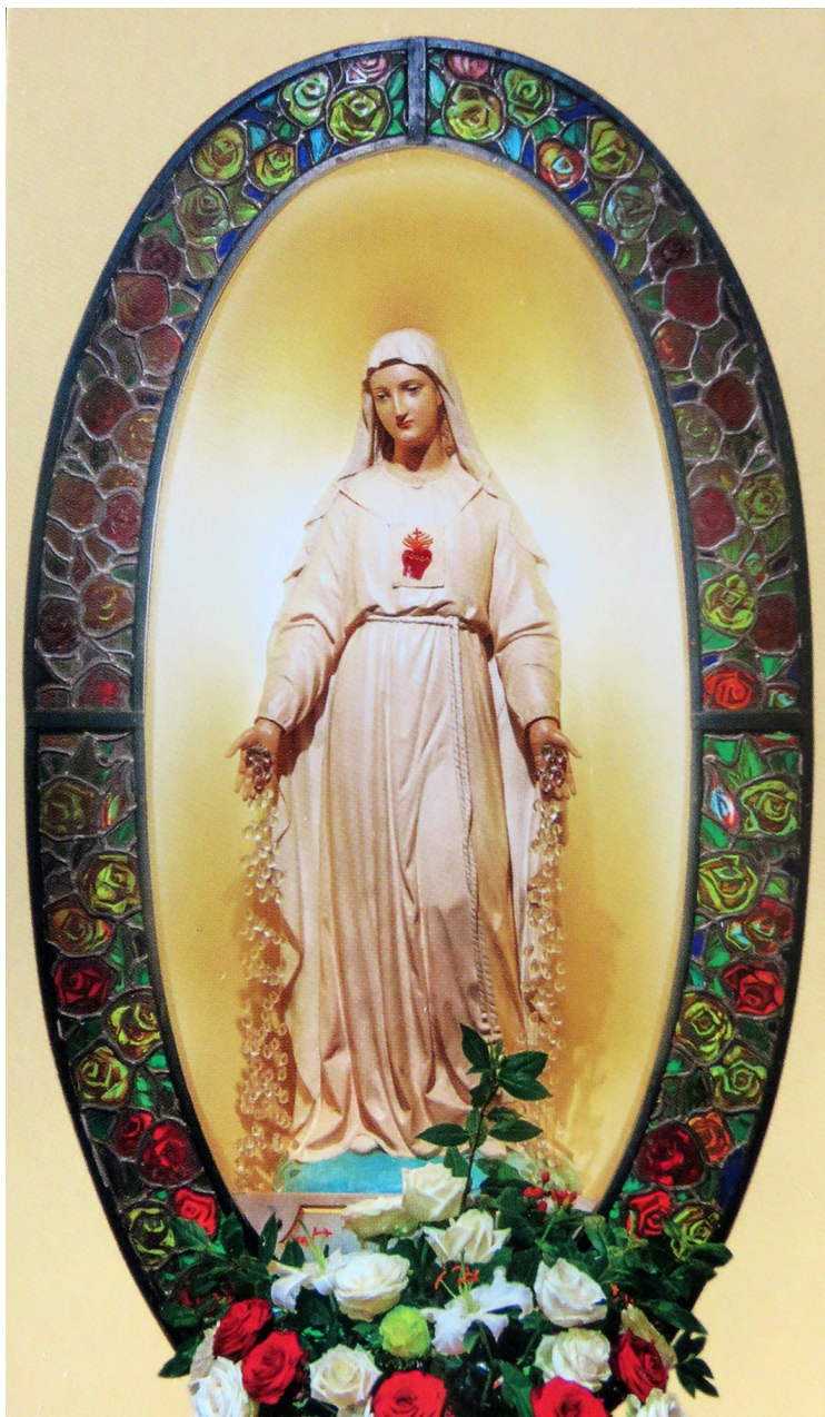
Notre-Dame de Pellevoisin

La Vierge Marie portait à chaque fois une petite pièce de laine sur la poitrine. Lors de cette neuvième apparition, elle dit : « Depuis longtemps les trésors de mon Fils sont ouverts ; qu'ils prient. » En disant ces paroles elle souleva la petite pièce de laine qu'elle