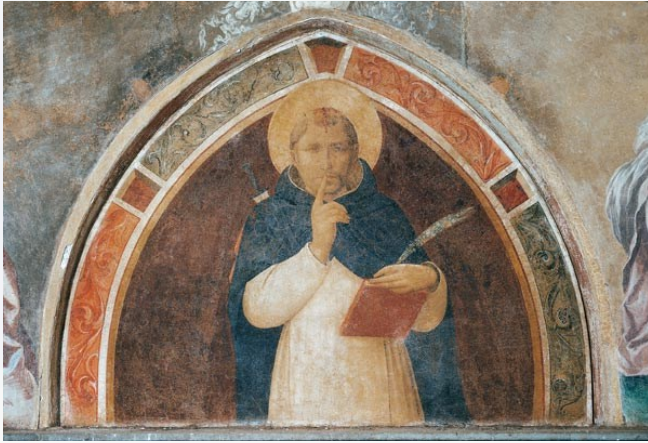
Saint Pierre, martyr, de Fra Angelico

Mais cette agitation vaine nuit à l'âme, gravement. Une telle saturation d'informations et de ragots empêche la réflexion profonde et la connaissance vraie du réel. De plus, elle rend impossible le silence qui est la condition sine qua non de l'intériorité, d'une vraie vie intellectuelle et spirituelle.