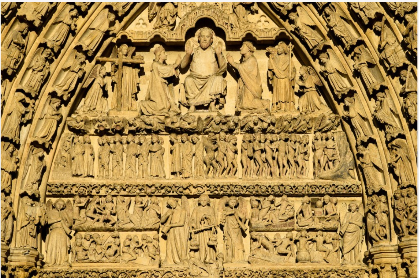
Jugement dernier, portail de la cathédrale d'Amiens, 1230

vraies à l'homme qui les formule parce qu'elles sont en conformité avec ce qu'il pense. Et peu lui importe de vérifier qu'elles sont en adéquation avec la réalité. Et ce qui est plus grave encore, c'est le fait que ces conjectures ne soient jamais démenties avec la même force que l'annonce initiale. Elles deviennent alors des vérités de fait dans la mémoire des auditeurs, créant une réalité parallèle bâtie sur du sable. « La nécessité de donner avec assurance une information immédiate force à combler les blancs avec des conjectures, à se faire l'écho de rumeurs et de suppositions qui ne seront jamais démenties par la suite et resteront déposées dans la mémoire des masses. Chaque jour, que de jugements hâtifs, téméraires, présomptueux et fallacieux qui embrument le cerveau des auditeurs - et s'y fixent ! » (Alexandre Soljenitsyne, Discours prononcé à l'université de Harvard, le 8 juin 1978).