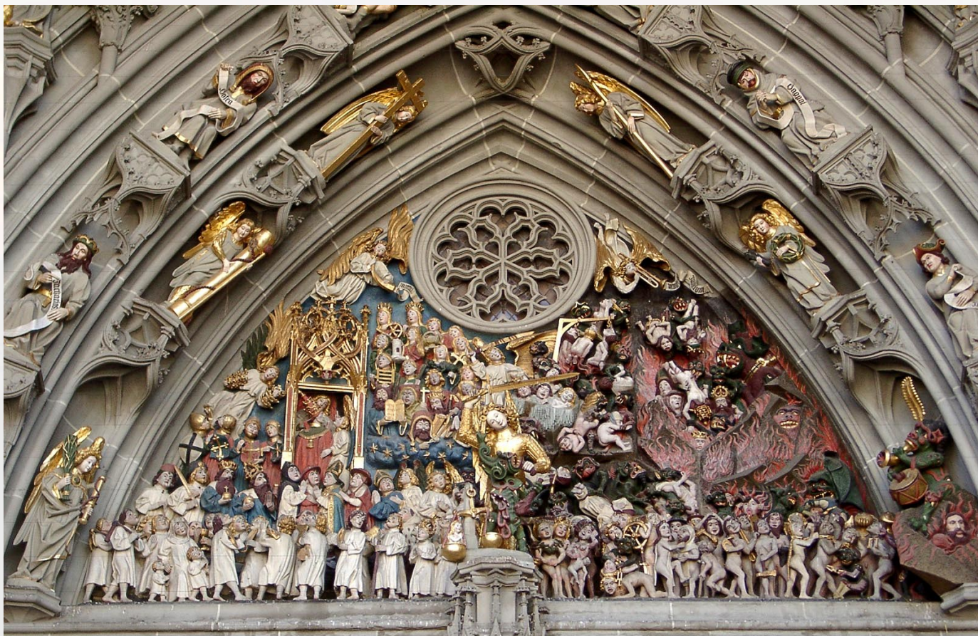
Tympan de la Collégiale Saint-Vincent de Berne en Suisse (fin XVe, début XVIe)

Par la discrétion et la bonté, reprenons nos frères en toute charité, mais gardons-nous de la médisance qui blesse la réputation du prochain au-dehors et aigrit les blessures sans les guérir : « Que le soleil ne se couche pas sur votre colère » (Eph. IV, 26). Confions nos inquiétudes, nos incompréhensions, nos anxiétés et nos colères à ceux qui sont en charge de gouverner et qui peuvent agir pour faire cesser les injustices et corriger les défauts qui nous font souffrir. Plutôt que de flatter notre égoïsme et médire sur le prochain, inversons courageusement les rôles : accusons-nous sincèrement devant Dieu de nos fautes et couvrons celles du prochain par une interprétation bienveillante, des paroles de miséricorde et un silence plein de charité.