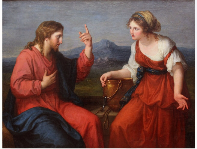
Jésus et la Samaritaine au puits de Jacob Angelica Kauffmann, 1770 environ

Pour l'âme qui cherche Dieu, ces expériences ne sont pas des idées abstraites. Ce ne sont pas non plus des projections subjectives sur la vie en Dieu. Ces expériences, douloureuses ou non, sont comme des indices de la vie de Dieu, des occasions où la grâce divine peut nous faire « sentir » en nous-