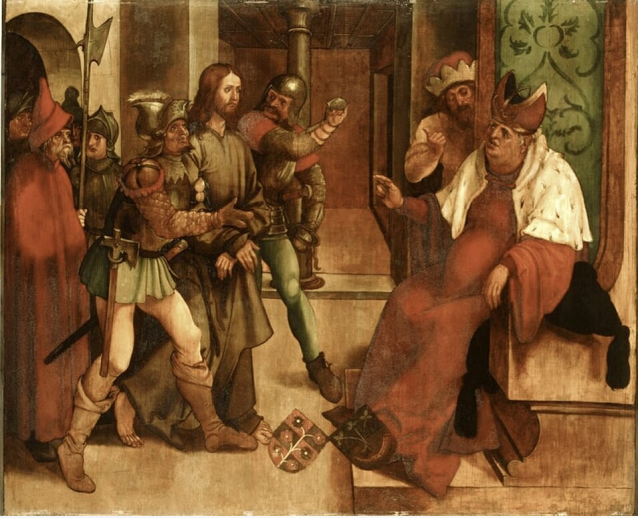
Jésus devant Caïphe, Maître du Cycle dominicain de Nuremberg (peintre anonyme), 1511-1512

priez pour ceux qui vous persécutent et vous calomnient » (Matt. V, 44) ; « La colère de l'homme n'accomplit pas la justice de Dieu » (Jacques I, 20).