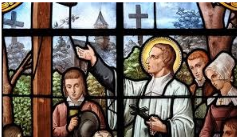
Saint Louis-Marie Grignon de Montfort

C'est ce que nous verrons le mois prochain.