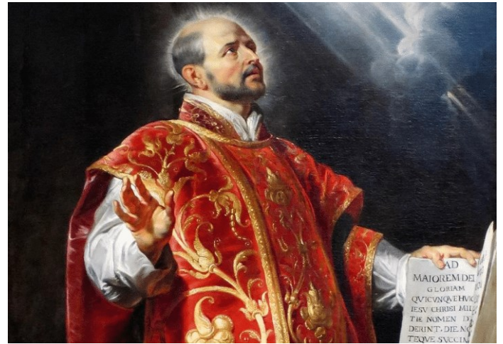
Saint Ignace de Loyola, fondateur des Jésuites