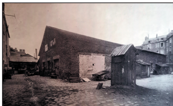
La cour de l'Entrepôt, début XX e s.

contre la propriété monastique et capitulaire. Mais bientôt, effrayé comme lui par les attaques contre la religion et l'Église, il s'oppose à la formation d'une Église gallicane et notamment à l'élection par les laïcs de ses ministres. Le 18 janvier 1791, il signifie par lettre son refus de prêter serment à la Constitution civile du clergé. Le 27 mars suivant, il est expulsé de son église Sainte-Croix, juste avant le début de sa démolition. Cette église se situait au chevet de la cathédrale à l'emplacement aujourd'hui de la place du même nom. Il doit de même abandonner son presbytère et aller habiter place Neuve. Conformément à l'arrêté du 1 er février 1792 pour les prêtres insermentés, il répond chaque jour à l'appel. Le 17 juin 1792, il est interné au Petit Sémi-