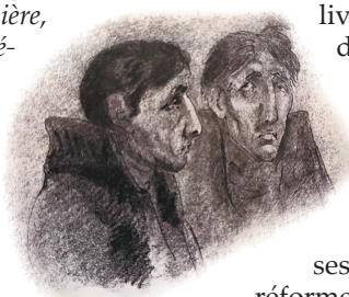
Jean-Baptiste Carrier (1756-1794) dessiné lors de l'audience du Tribunal révolutionnaire