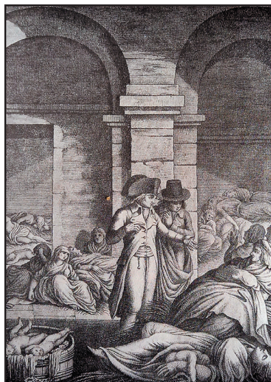
L'Entrepôt au temps de Carrier Gravure extraite de La Loire Vengée , an III

confie à la citoyenne Dumais, épouse du régisseur. Il lui demande de faire célébrer des messes pour le repos de leurs âmes. Mais prise de panique, elle les remet au Comité.