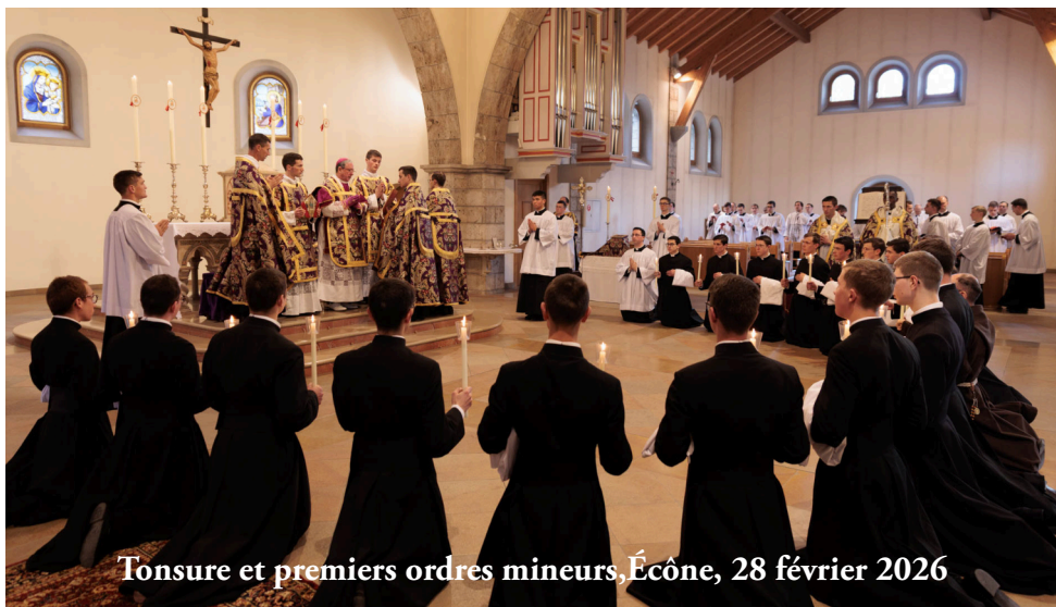
Tonsure et premiers ordres mineurs, Écône, 28 février 2026