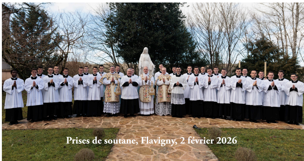
Prises de soutane, Flavigny, 2 février 2026

Rendons grâce pour ces nouvelles vocations données par Dieu, et prions à leur intention !