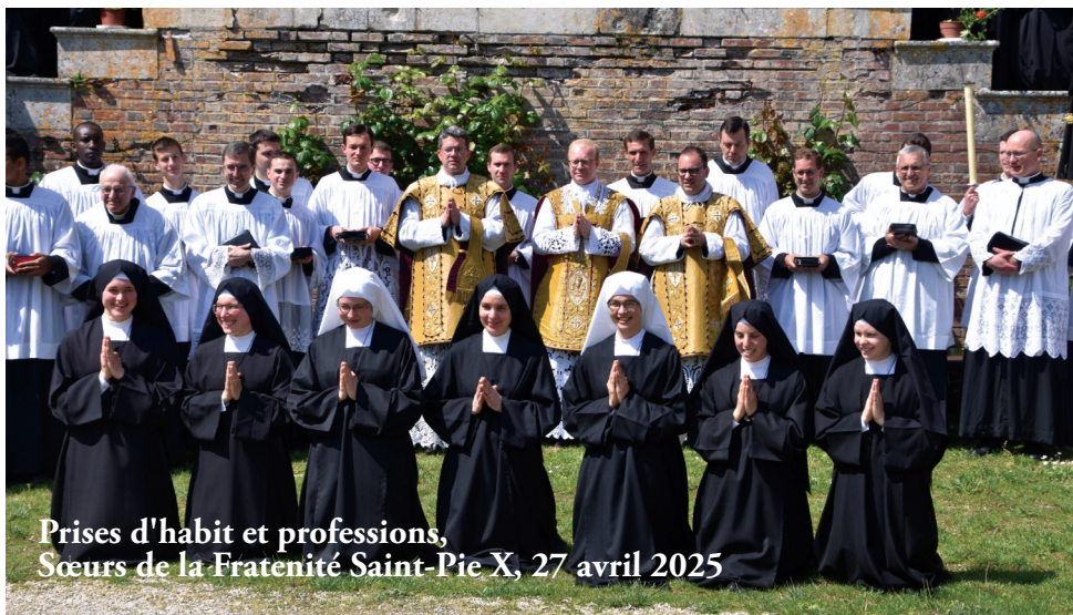
Prises d'habit et professions, Sœurs de la Fraternité Saint-Pie X, 27 avril 2025

Se dévouer à d'autres que lui pour lui manifester qu'il n'est pas le centre du monde