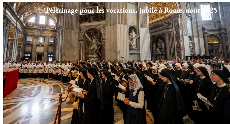
Pèlerinage pour les vocations, jubilé à Rome, août 2025

conciliaire, et non un rejet orgueilleux. La Fraternité investit beaucoup dans la formation et la clarté doctrinale, même si nous sommes conscients de notre imperfection... mais nous constatons que notre ligne claire suscite des vocations, l'âme humaine ayant besoin de cohérence.