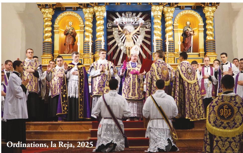
Ordinations, la Reja, 2025

La clarté construit l'intelligence de la foi ; l'ambiguïté la rend confuse, ouverte à tous vents de doctrine, aux interprétations abusives et donc au doute. Jésus disait « que votre oui soit oui, que votre non soit non, tout le reste vient du Malin. » C'est précisément notre attitude au sujet de Vatican II et du Magistère post-