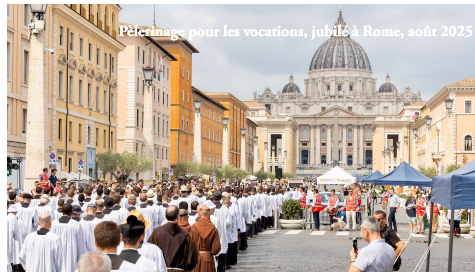
Pèlerinage pour les vocations, jubilé à Rome, août 2025

très vite comprendre et admettre à l'enfant qu'il n'est pas le seul être qui importe sur la terre mais que d'autres existent et que ces autres ont des besoins et des désirs aussi importants que les siens. Et c'est là encore tout le contraire de l'égoïsme.