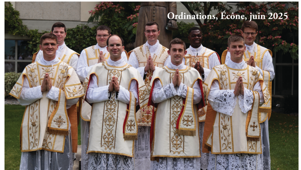
Ordinations, Écône, juin 2025

l'enfant gaspille, c'est en entendant prononcer des paroles grossières que l'enfant répète les grossièretés. Cela étant, il ne suffit pas à l'adulte de montrer l'exemple du dévouement pour être quitte, sans quoi l'enfant risque fort de s'enfermer dans un égoïsme irréductible. Il faut encore l'impliquer très tôt dans cet apprentissage. Car c'est un danger réel qu'en voyant les grandes personnes se dévouer pour lui, l'enfant devienne lui-même égoïste. En effet, le dévouement perpétuel qui lui est prodigué peut l'entretenir dans la conviction que tout lui est dû et que tout doit converger vers lui. Il prendra alors facilement la dangereuse habitude de réclamer et d'obtenir toujours