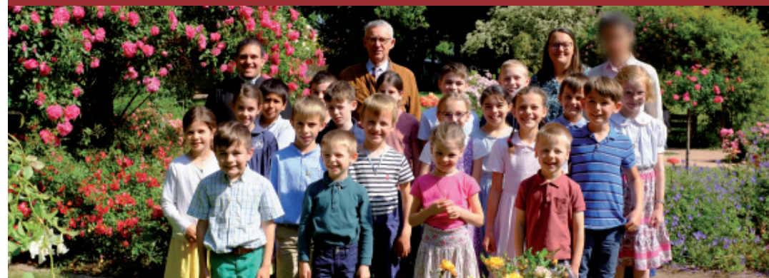
ÉCOLE SAINT-JOSEPH | CHARTRES