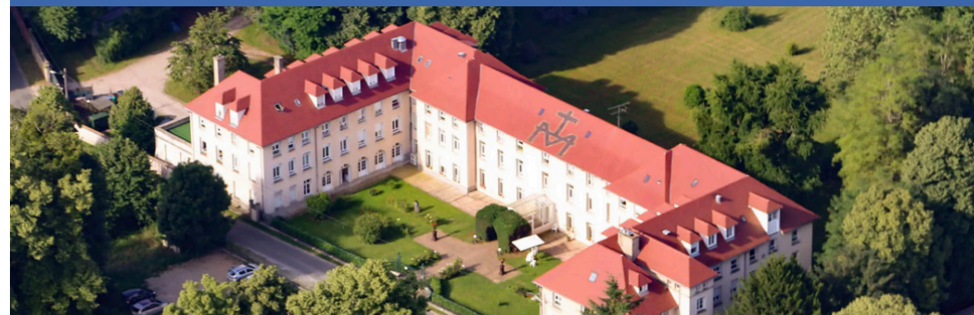
MAISON DE RETRAITE LE BRÉMIEEN NOTRE-DAME | ILLIERS-L'ÉVÊQUE