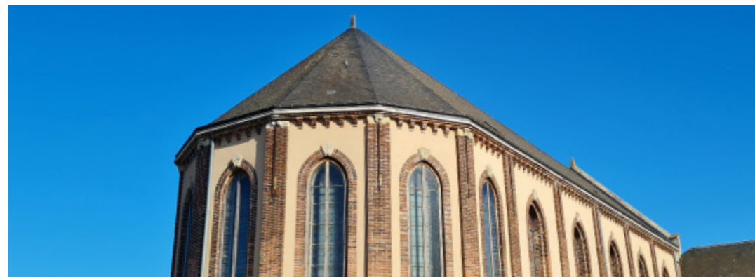
CHAPELLE SAINT-PIE X | CHARTRES