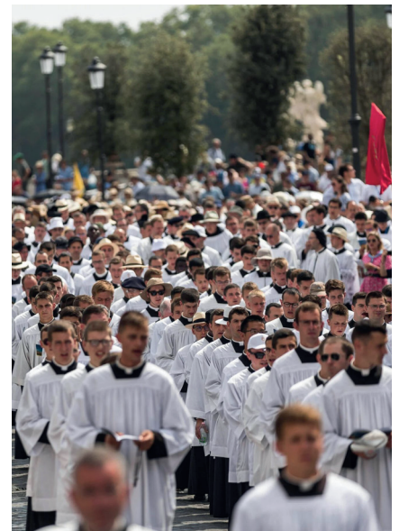
Pèlerinage jubilaire à Rome, août 2025. La Fraternité... Ce sont deux évêques, 733 prêtres, 264 séminaristes, 145 frères, 88 oblates, 250 sœurs...

Ainsi les autorités officielles de l'Église étant toujours imprégnées des erreurs modernes, la Fraternité Saint-Pie X est plus que jamais nécessaire pour permettre au maximum d'âmes de bénéficier des trésors de la Tradition et, vu son extension dans le monde entier, deux évêques âgés de près de 70 ans ne suffisent plus pour répondre à l'attente de l'ensemble des fidèles et des séminaristes.