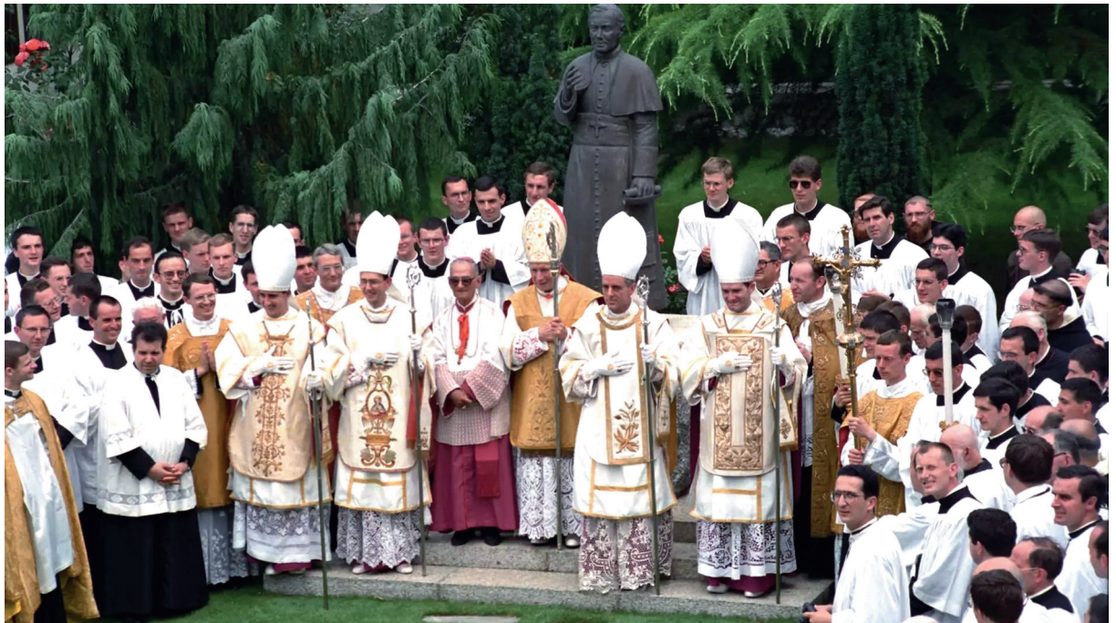
« Mgr Lefebvre se demanda s'il ne serait pas opportun de sacrer des évêques pour permettre la survie de la Tradition... » Ce qu'il fit, le 30 juin 1988.

naturalisme (refus de l'ordre surnaturel, négation du péché originel, exaltation de la nature), le libéralisme (recherche exagérée d'indépendance partant d'une fausse conception de la liberté), le modernisme (recherche de conciliation