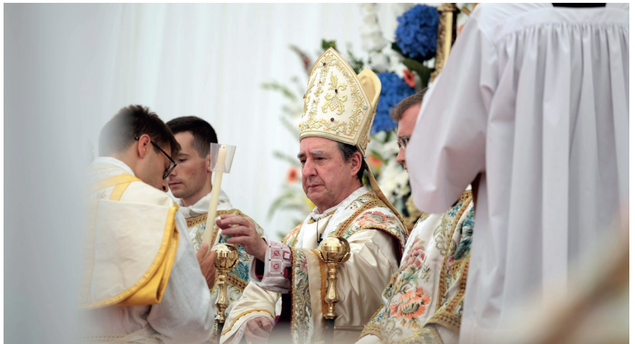
Ordinations sacerdotales à Écône en 2025. Sans évêques, plus d'ordinations, plus de confirmations...

Quant à la célébration de la messe traditionnelle, nous nous sommes réjouis en voyant le pape Benoît XVI élargir la possibilité pour les prêtres d'utiliser le rite dit de saint Pie V, par son motu proprio Summorum pontificum du 7 juillet 2007. Malheureusement, cette ouverture ne fut que de courte durée, puisque le pape François y a mis fin par le motu proprio Traditionis