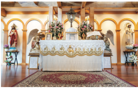
Des paroissiens exaucés !

La cérémonie d'inauguration et de bénédiction a été célébrée par l'abbé Bernard de Lacoste, Directeur du Séminaire Saint-Pie X à Écône.