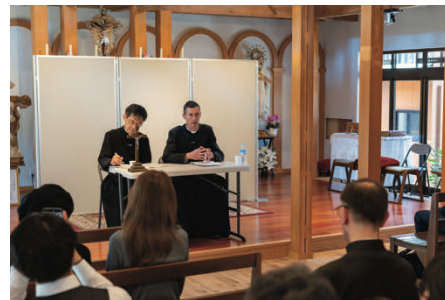
Conférence dans la chapelle

Au Japon, l'apostolat avance dans la discrétion. Il ne se mesure pas en nombre, mais en fidélité.