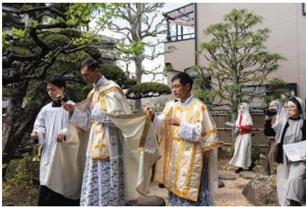
Bénédictio de la nouvelle chapelle

La cérémonie d'inauguration et de bénédiction a été célébrée par l'abbé Bernard de Lacoste, Directeur du Séminaire Saint-Pie X à Écône.