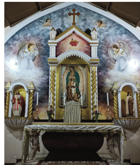
Une image, de qualité moyenne...

1531. Mais je ne savais pas trop comment me procurer une telle réplique, si ce n'était peut-être en faisant un pèlerinage au Mexique... Pas évident à organiser.