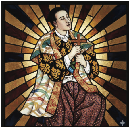
Le Bienheureux Justo Takayama Ukon

Après plusieurs années de recherche et de discernement, la Providence a conduit la communauté vers Takatsuki, ville paisible et centrale, facilement accessible depuis les grandes métropoles du Kansai.