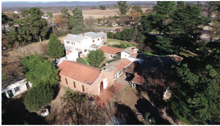
Vue sur l'école

Mais que faire pour les garçons en secondaire? Un terrain a été acquis sur la même commune et, sous la responsabilité des Mères, des fidèles assurent les cadres et l'organisation de la section «San Juan Bosco».