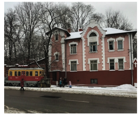
Le bâtiment de l'ancienne chapelle