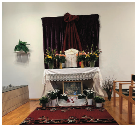
Initialement, une modeste chapelle

Il y a 20 ans, pour la dernière fois, la FSSPX célébrait le Triduum en Suède. Dans la petite chapelle de mission, à Kalmar, environ 40 fidèles participaient à ces liturgies.