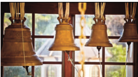
Les joyeuses voix de la chapelle

Dans ce pays où les chrétiens sont peu nombreux, chaque chapelle devient un refuge. La chapelle de l'Immaculée Conception n'est pas seulement un bâtiment : elle est une maison pour Dieu, et une maison pour les âmes.