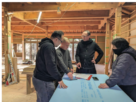
Une préparation minutieuse

Le bâtiment choisi, une maison japonaise traditionnelle d'environ 200 m 2 , entourée de murs qui assurent calme et intimité, a fait l'objet d'une rénovation complète.