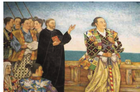
Le B x Justo Takayama Ukon conduit la procession

Samouraï issu d'une famille noble, Takayama Ukon fut baptisé à l'âge de 12 ans et choisit de renoncer à ses titres et à ses terres plutôt que d'abjurer sa foi. Exilé à Manille, il mourut en odeur de sainteté peu après son arrivée. Sa fidélité héroïque fit de lui l'un des symboles les plus lumineux du christianisme japonais.