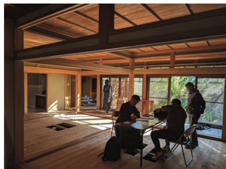
Sous la protection de St Joseph

Les travaux ont concerné la consolidation de la charpente, la création d'une tribune pour la chorale, d'une sacristie, ainsi que l'aménagement d'un sanctuaire simple, lumineux et empreint de dignité liturgique.