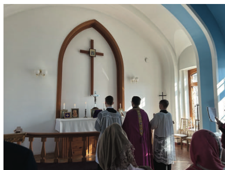
La chapelle dans l'église luthérienne