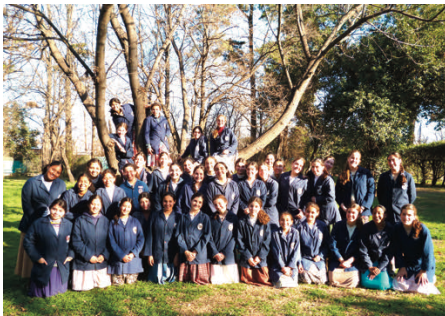
Nos 40 pensionnaires