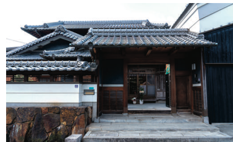
La chapelle du Cœur Immaculé de Marie

Une présence discrète et fidèle de l'Église au cœur du Kansai