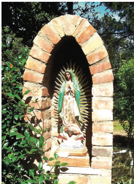
Nuestra Señora de Guadalupe veille sur le secondaire