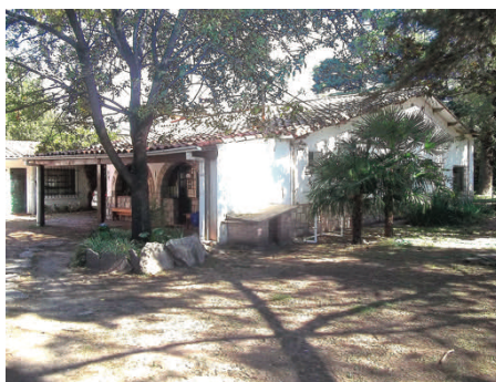
2001: la première maison

Le 12 octobre 2000, fête de Notre-Dame de Luján, protectrice de l'Argentine, et anniversaire de la découverte des Amériques par Christophe Colomb, la Congrégation des Dominicaines enseignantes de Saint-Pré essaimait en Amérique Latine.