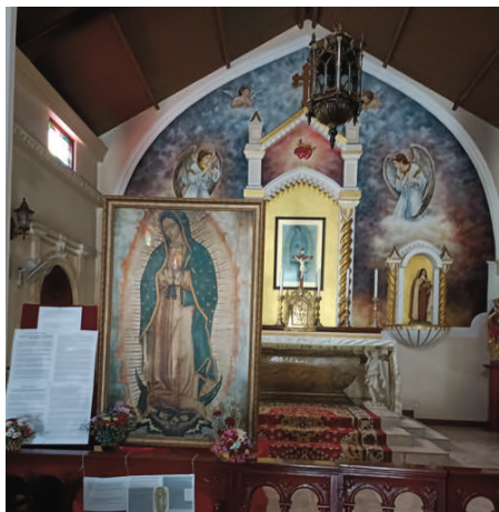
Quand la Sainte Vierge prend les choses en main...