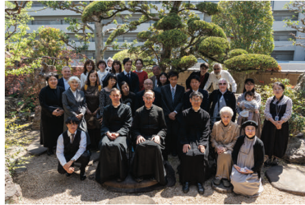
Des paroissiens exaucés !

Dans un monde souvent dominé par le bruit et l'agitation, ces cloches rappelleront l'essentiel : Dieu est présent, et Il appelle encore.