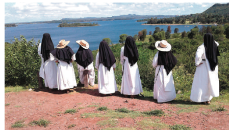
Paysage de la province de Córdoba

C'est pourquoi nous remercions «MISSIONS» d'accepter de secourir notre œuvre. Notre gratitude et nos prières s'étendent à tous nos bienfaiteurs; chaque jour, les enfants récitent une dizaine de chapelet à cette intention, et une messe est dite chaque mois pour tous nos bienfaiteurs.