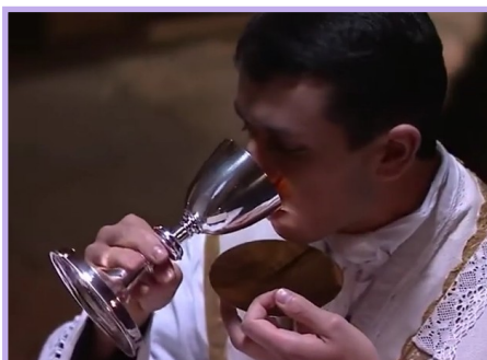
Communion du prêtre

C'est le seul instant de la Messe où la liturgie invite le prêtre à une méditation per-