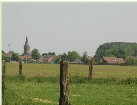
Le village de Coutiches

On profitera assurément de ces bienfaits en suivant l'un