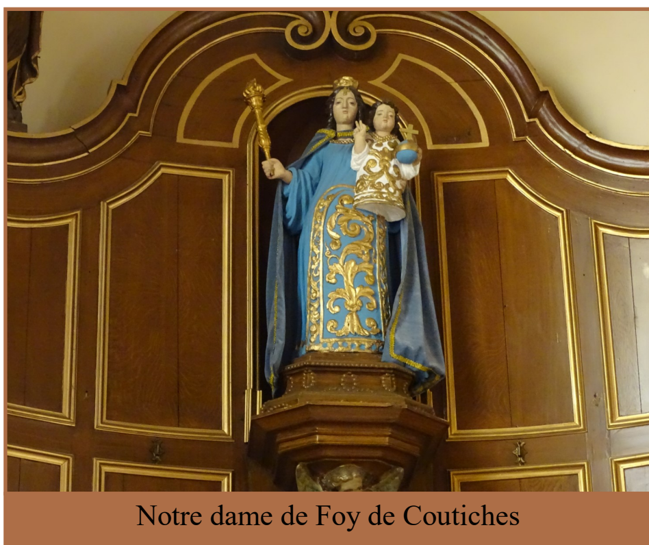
Notre dame de Foy de Coutiches

Marcher entretient la forme physique, mais pas l'orgueil ni le culte du corps (il n'y a pas beaucoup de records enregistrés sur les sentiers de petite ou grande randonnée – PR ou GR pour les habitués). Si l'on sait marcher