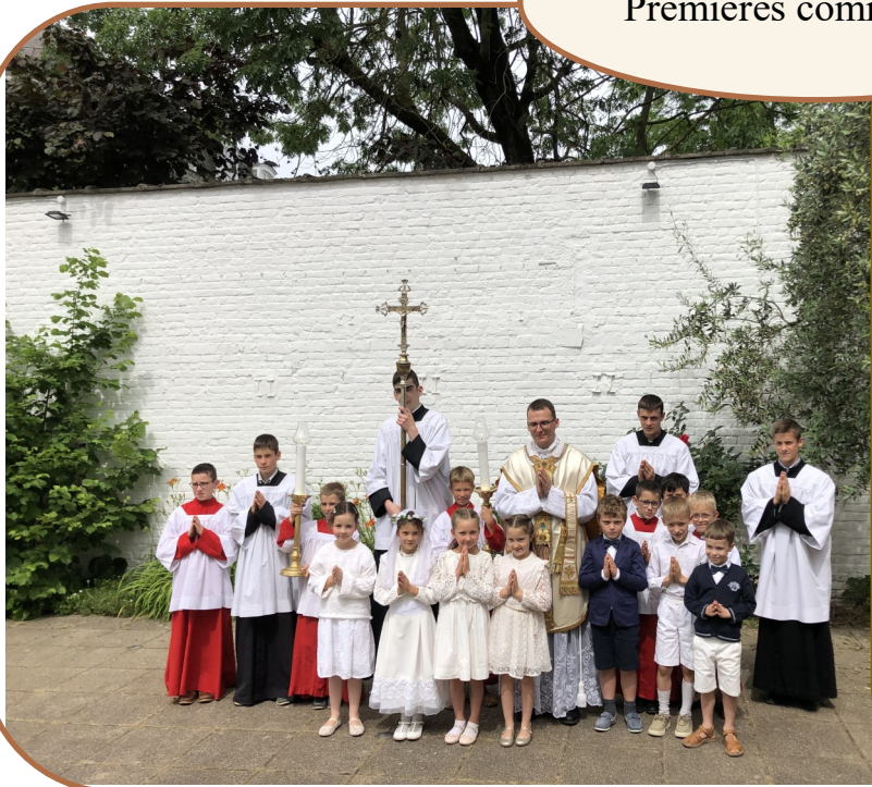
31 mai Premières communions