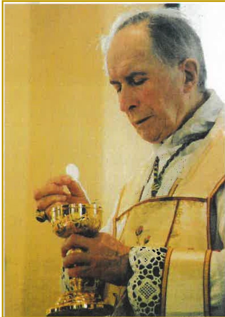
Monseigneur Lefebvre donnant la communion

Cette requête, adressée aussi à Notre-Seigneur en tant qu'il nous transmet la vie du Père, résume le mystère de l'Incarnation et de la Rédemption tout en rappelant la nécessité de la vie surnaturelle pour communier. Encore une fois, le pardon des péchés est lié au