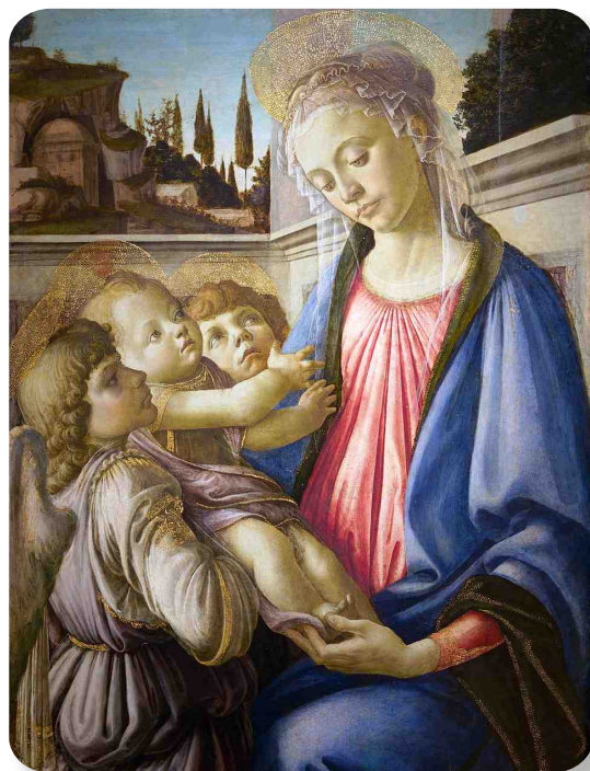
La Vierge à l'Enfant avec deux anges Botticelli (1469)

et la pureté. C'est cela la beauté d'une créature composée d'un corps de chair et d'une âme spirituelle et immortelle.